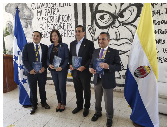
Figura No. 2 Presentación con autoridades y ante comunidad universitaria, fuente propia de autores