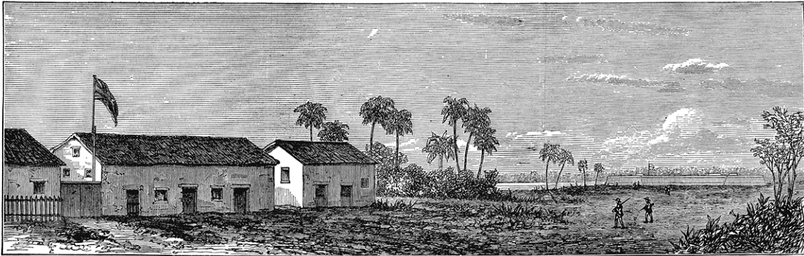
El consulado británico en Omoa. Ilustración publicada en un artículo anónimo titulado The bombardment of Omoa publicado en The Illustrated London News , noviembre 8, 1873, página 441. Véase hacia el extremo central derecho de la imagen la cortina de la Fortaleza San Fernando de Omoa y las aguas del mar Caribe.