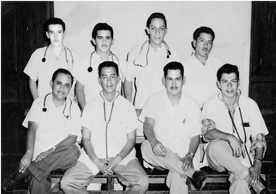
En la Revista Médica Hondureña 4 figura el Dr. Jorge Haddad Quiñonez como graduado el 28 de febrero de 1958 en la especialidad de Gastroenterología. En la fotografía aparece junto a otros jóvenes estudiantes de medicina.

ha tenido cuatro profundas transformaciones, figurando el Dr. Haddad como protagonista de la Cuarta Reforma Universitaria desde su papel efectuado al frente de la Comisión de Transición. En sus postulados, Jorge Haddad Quiñonez propone que la Cuarta Reforma sea el punto de partida de reforma institucional permanente. Como fruto de ello, se cuenta con una mayor representatividad en el ámbito nacional al crearse y mejorarse las condiciones e infraestructura de los centros universitarios regionales que se encuentran distribuidos en todo el país. Así mismo, la UNAH a través de la Dirección de Cultura, plantea el fortalecimiento operativo así como la adecuada gestión cultural y preservación de bienes y expresiones patrimoniales atesoradas