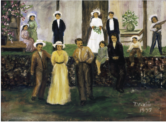
◀ Teresa Victoria Fortín. 1977. Vida en familia . Óleo sobre tela. Esta obra fue portada del libro de Rina Villars titulado Para la casa más que para el mundo: Sufragismo y Feminismo en la Historia de Honduras .