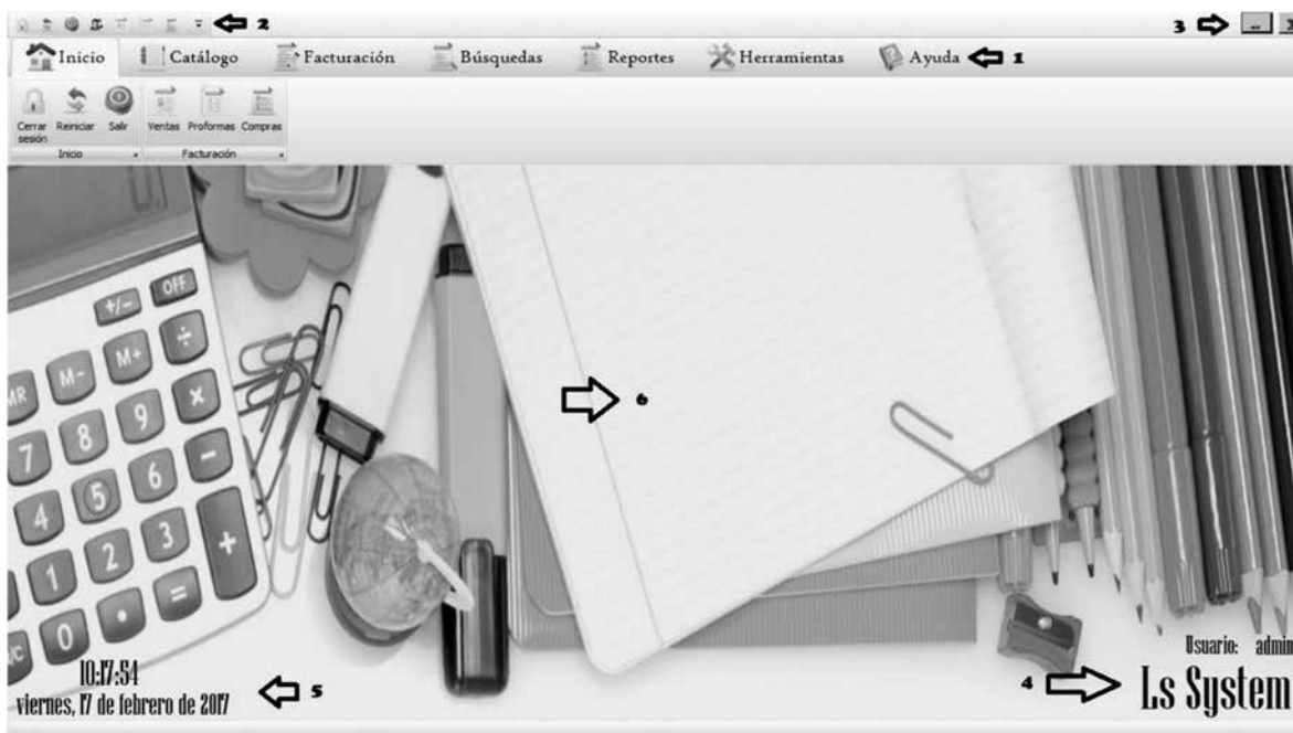
Gráfica 3. Pantalla principal del sistema Ls System