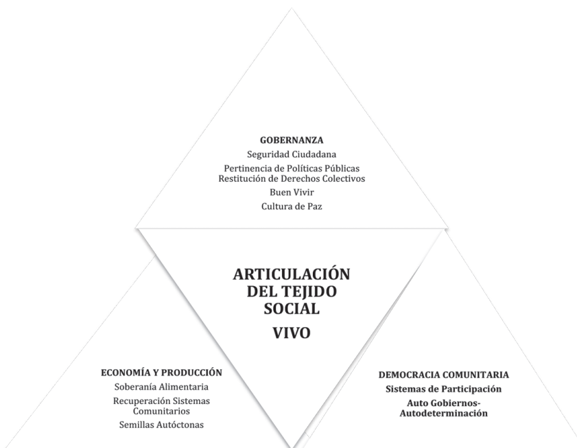
Figura 3: Articulación del tejido social