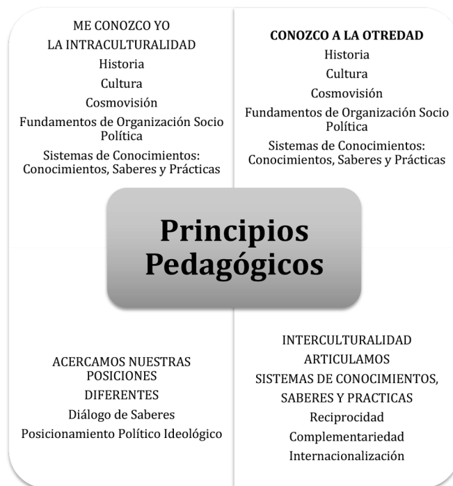
Figura 1: Descolonización educativa.