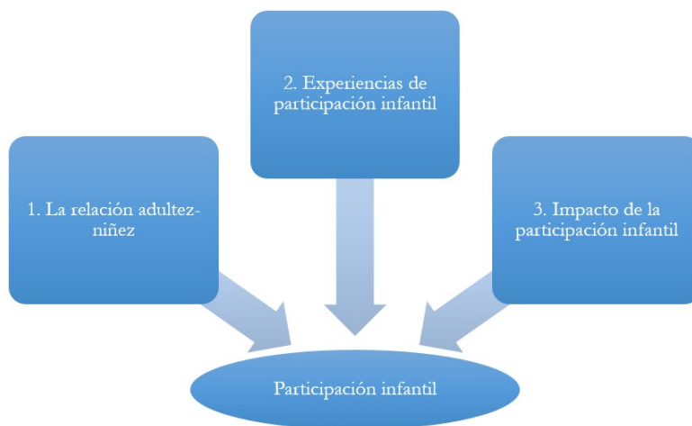
FIGURA 1 Líneas de investigación y análisis

En primer lugar, encontramos las investigaciones centradas en exponer y explicar las relaciones y las dinámicas existentes entre la adultez y la niñez que determinan el tipo y alcance de participación infantil en determinados contextos. Aquí se ubican los trabajos de Lay-Lisboa y Montañés (2018, p.2) cuyo objetivo consistió en dar cuenta de cómo los niños y las niñas conciben y construyen diferentes tipos de participación. La investigación toma distancia del paradigma tradicional que concibe a los niños y las niñas como sujetos débiles, inmaduros, inocentes o incapaces, y los define como “responsables y dueños de su propio desarrollo, con autonomía y capacidad de participar responsablemente en el ejercicio y construcción de ciudadanía”. Por su parte, el de Gallego y Gutiérrez (2015) fue realizado con la finalidad de comprender las relaciones entre las concepciones de participación de padres y madres de familia, así como de los agentes educativos con la toma de decisiones de los niños de tres y cuatro años. Estos autores recuperan la categoría de participación adultocéntrica.