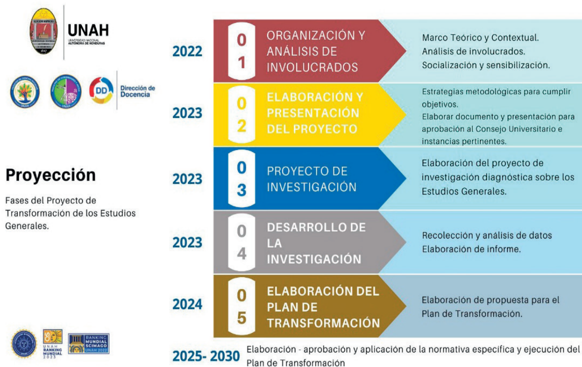
Figura 1. Fases del Proyecto de Transformación de los Estudios Generales

Nota: La Figura 1 presenta las fases y los periodos de tiempo en los que se desarrollará el Proyecto de Transformación de los Estudios Generales en la UNAH.