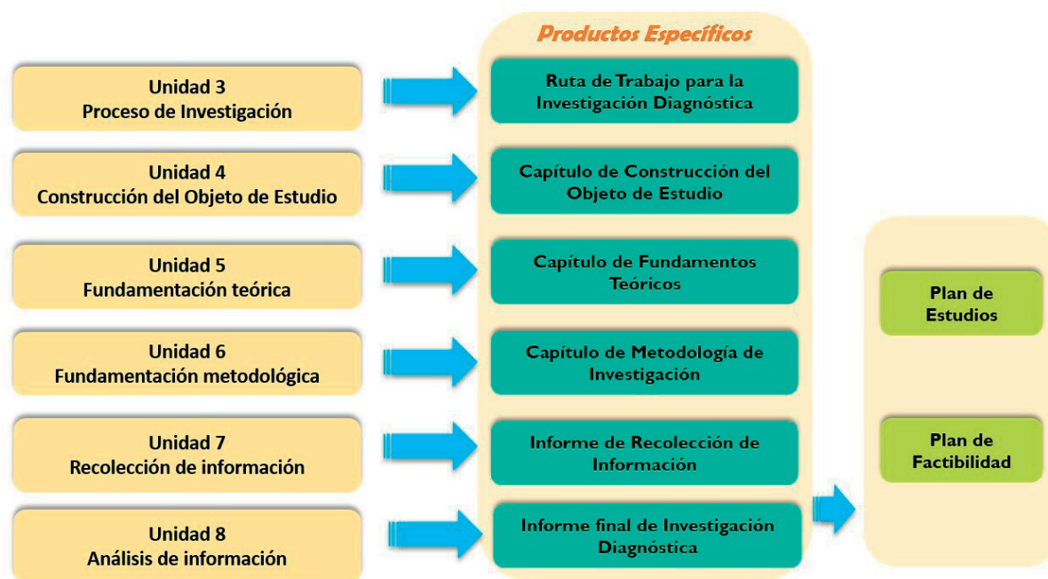
Figura 4. Productos específicos requeridos al final de cada unidad temática