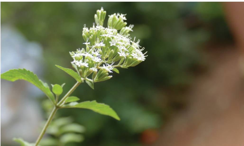
Saucu, planta utilizada especialmente en las comunidades lencas del departamento de La Paz.