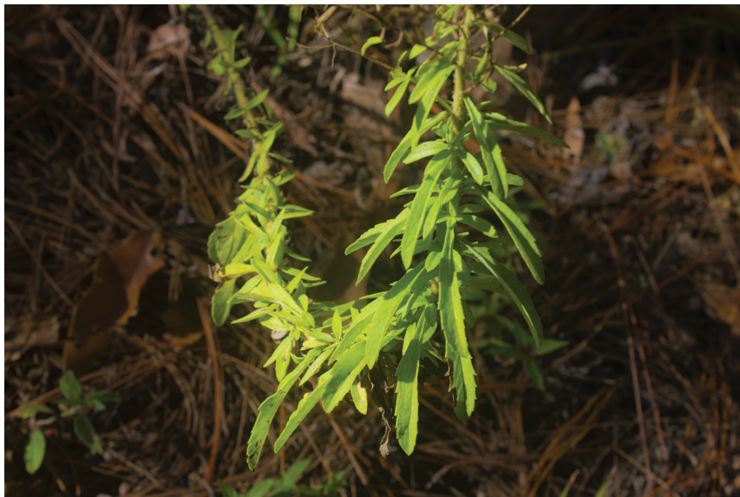
Raíz de octubre, planta medicinal utilizada en las comunidades lencas comprendidas para el estudio.

mer lugar en el “don” de sanación que cada uno de ellos ha recibido y los faculta para actuar en este campo.