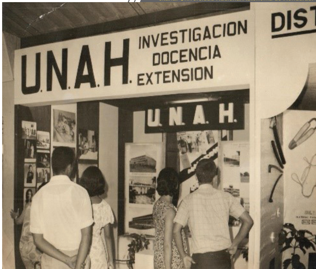
Figura 1. Exposición de actividades realizadas por el Departamento de Extensión Universitaria en feria estudiantil (1969).