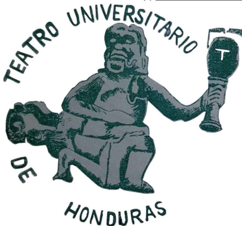
Ilustración 1: Logo del Teatro Universitario de Honduras (TUH).