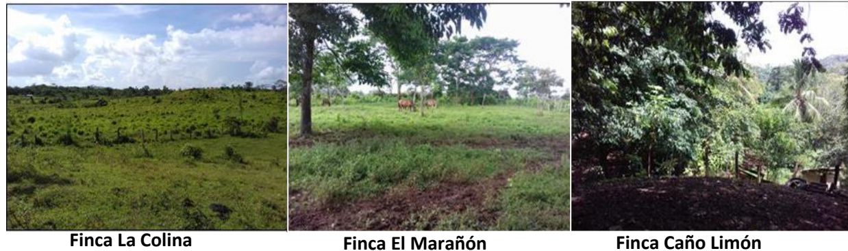
Figura 1. Estado agroecológico de las fincas estudiadas

comunidad. También existe mucha diversidad de cultivos perennes: coco, cacao, mango, guayabas, fruta de pan, etc. (Ver figura 1).