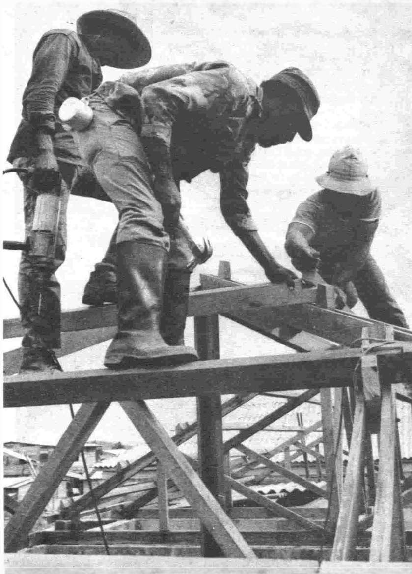
Brigadas de construcción, Bluefields, 1988.