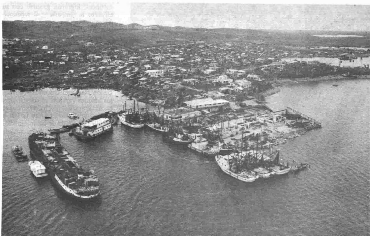
Barcos cubanos en el muelle de Bluefields, 18 de noviembre de 1988.