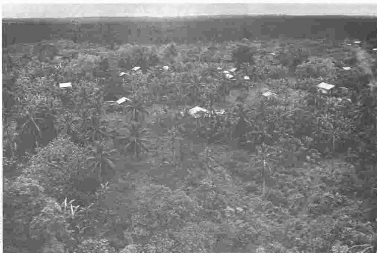
Comunidad indígena, 1990.

La Justicia no es un principio aislado ni una entidad pura; al contrario, se encuentra estrechamente ligada a los intereses sociales que tienen acción en un determinado momento en cualquier sociedad. Parlamos de una hipótesis que afirma la existencia de formas de organización social y de administración de justicia en las comunidades indígenas de las regiones autónomas, que constituyen formas de derecho consuetudinario o costumbres jurídicas. Estas lógicamente no son puras ni poseen una perfecta y elaborada técnica jurídica, sino que expresan esa dialéctica de la cultura y la identidad manifiesta en la confrontación entre la organización tradicional y la imposición foránea.