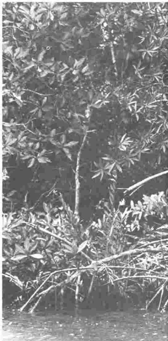
Manglares, Río Grande de Matagalpa.

Los participantes realizarán una serie de visitas y asistirán a varios talleres en Costa Rica en instituciones como la Organización para Estudios Tropicales (OET), el Centro Agronómico Tropical para la Investigación y la Enseñanza (CATIE) y la Dirección General Forestal (proyectos agroforestales y de reforestación, fincas demostrativas, cooperativa de pequeños productores).