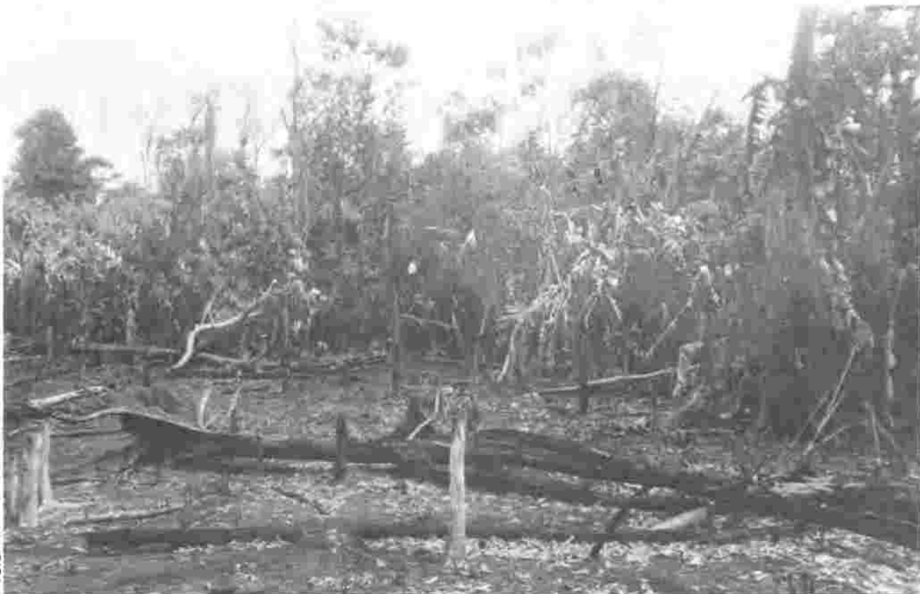
Una "quema tradicional", para la siembra de plátanos, Caño Negro.

iniciar prácticas agroforestales, mientras que otros no lo han realizado. Para la investigación hemos llevado a cabo dos estudios de caso de campesinos que están comenzando estas prácticas, y aquí ofrecemos en forma sucinta uno de ellos.