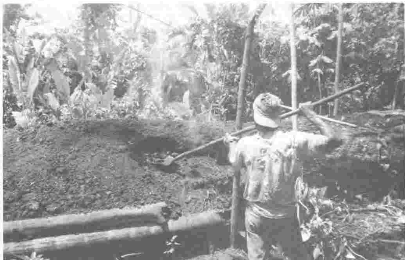
Corte de madera para la quema de carbón (esp. Almendra), Caño Negro.