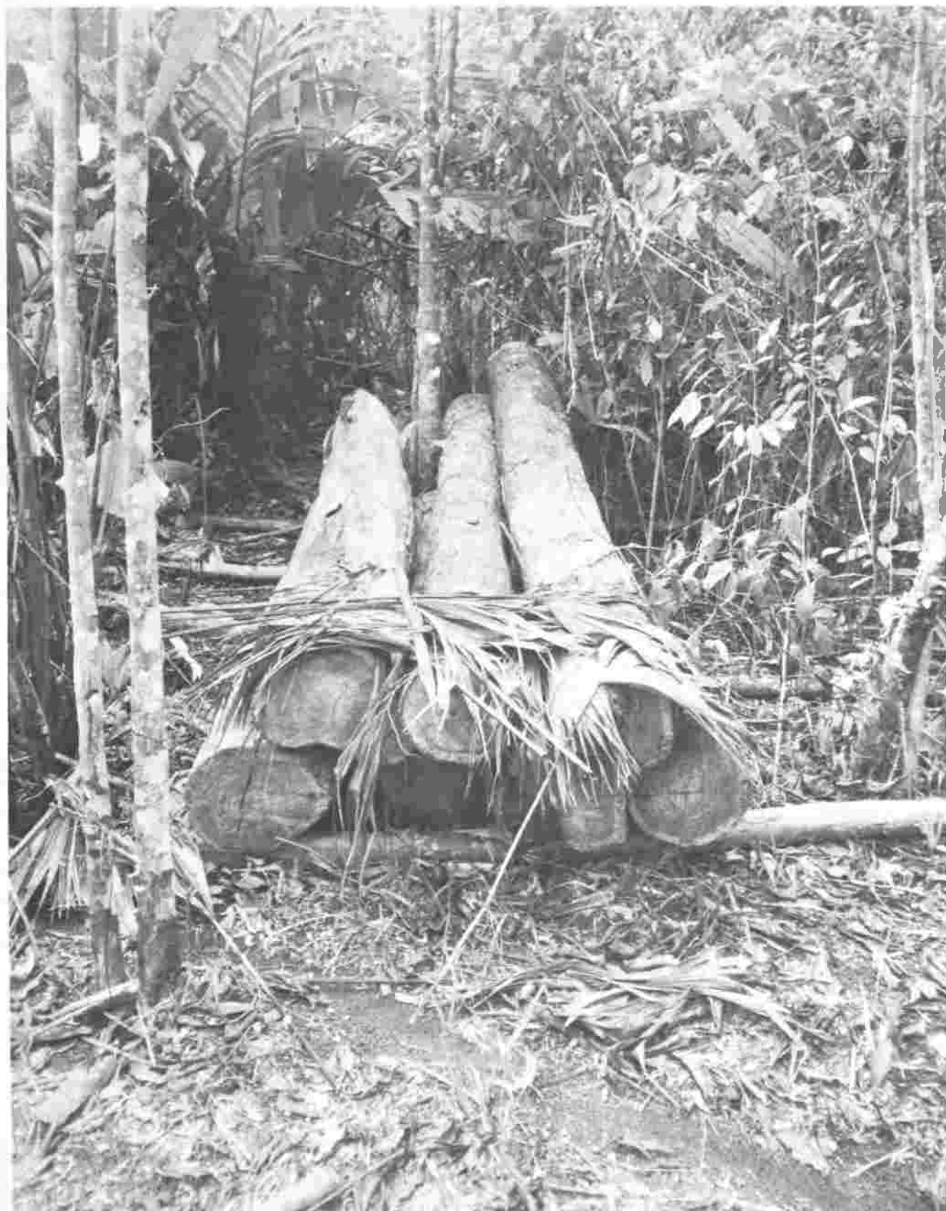
Madera para la construcción (esp. Laurel). Árboles cortados antes de una quema , Caño Negro.