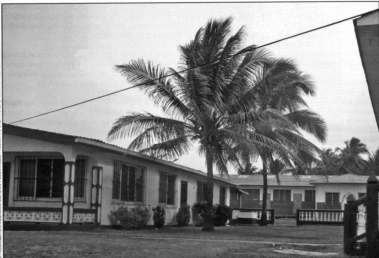
Escuela-Iglesia Morava. Corn Island 2011.