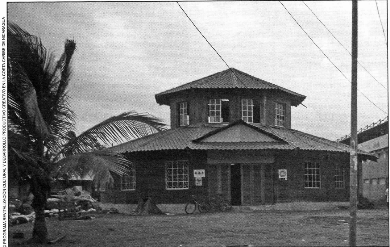
© PROGRAMA REVITALIZACIÓN CULTURAL Y DESARROLLO PRODUCTIVO CREATIVO EN LA COSTA CARIBE DE NICARAGUA