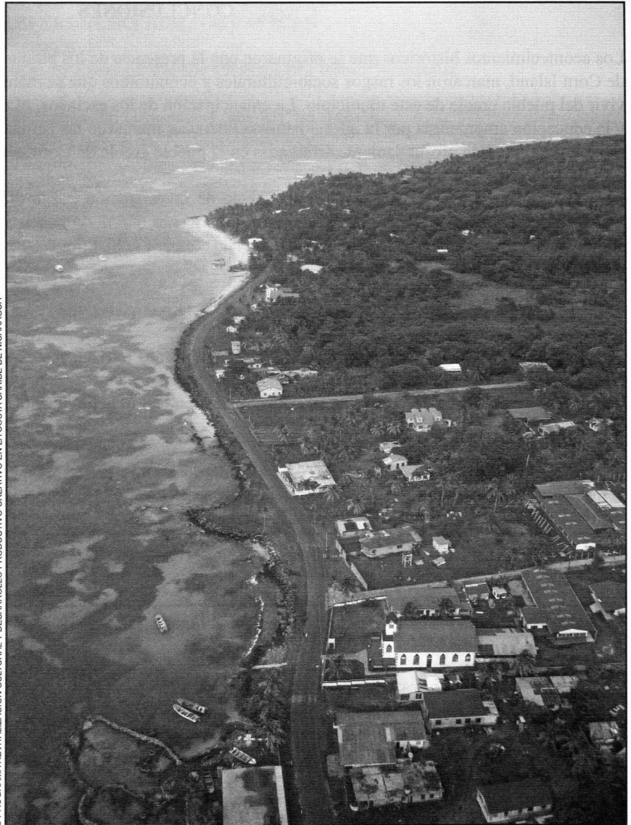
Vista aerea de la Ciudad . Corn Island 2011.