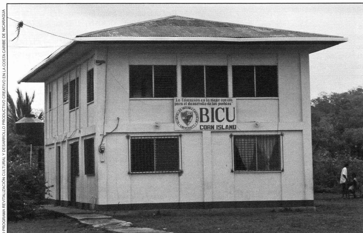
Bluefields Indian & Caribbean University. Corn Island 2011.