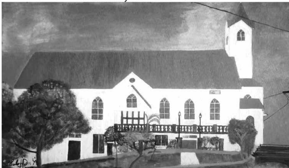
Iglesia Morava. Cresencio Salomon, 2009 (acrílico sobre tela).