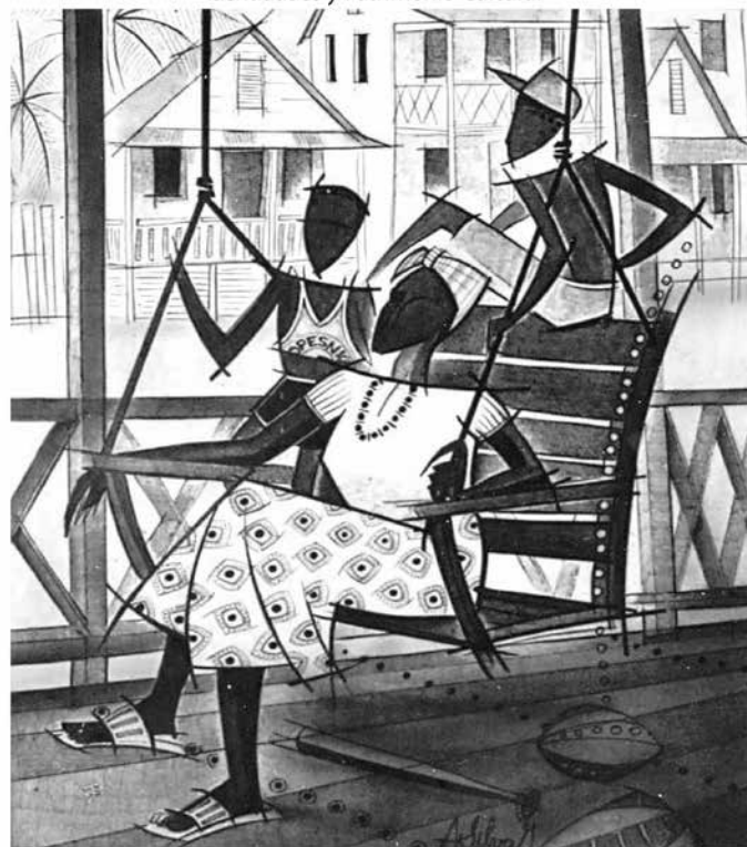
La Tía María en el balcón. Augusto Silva, 1993 (Acrílico sobre tela).

Gobierno de Reconciliación y Unidad Nacional 22 Pueblo, Paralelo 21