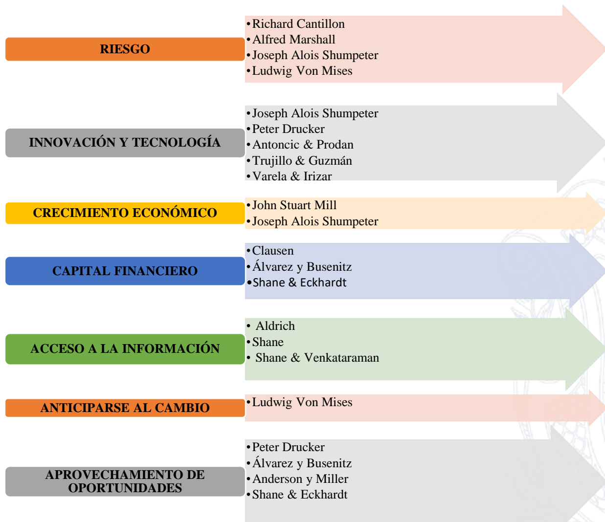
Figura 1. Factores de emprendimiento y autores representativos