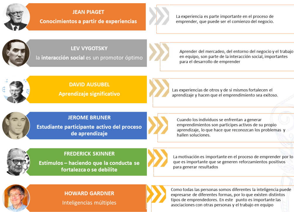
Figura 2. Relación de las teorías de la educación expuestas con el desarrollo del emprendimiento