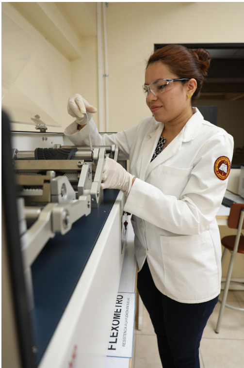
Figura 4. Ensayo de flexión en suela.

Los resultados de estas pruebas permitieron conocer y analizar los parámetros actuales en los cuales se encuentra la fabricación del calzado escolar en la MIPYMES del país.