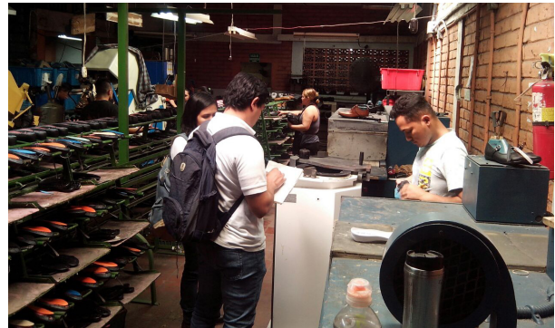
Figura 3. Estadía en empresa MIPYME del sector calzado.