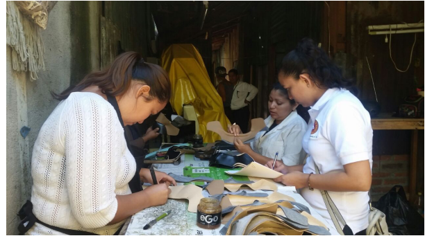
Figura 2. Estadía en empresa MIPYME del sector calzado.

dores. Por consiguiente, los proveedores no se ven obligados a entregar hoja de especificaciones técnicas que asegure la calidad del producto a los fabricantes.