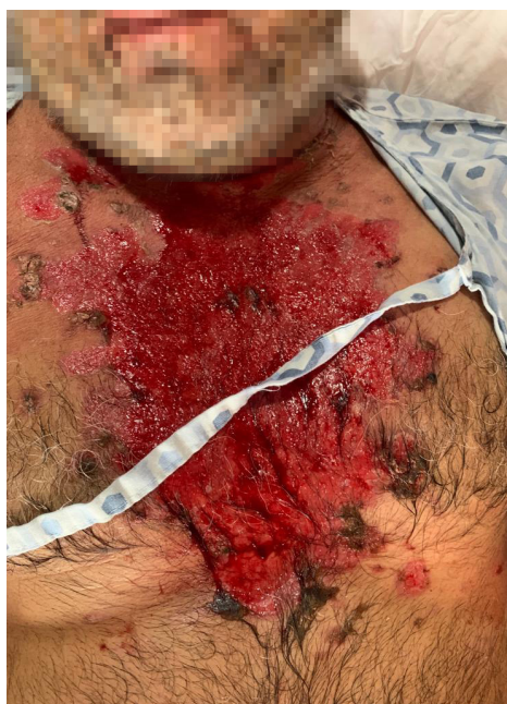
Figura 2. Estado de paciente post hidroterapia

El pénfigo foliáceo también llamado pénfigo superficial, es una enfermedad poco frecuente, de curso crónico, que se caracteriza por presentar lesiones únicamente en la piel 3 y por la presencia de anticuerpos antidesmogleína 1 en el área subcorneal 11 . Se clasifica en endémico ( fogo selvagem ), y no endémico o esporádico 7 . En esta última se encuentra una variedad conocida como pénfigo seborreico, que se identifica por ser localizada y también se conoce como pénfigo eritematoso o síndrome de Senear-Usher 8 .