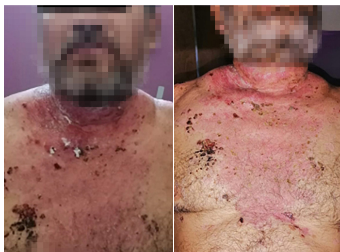
Figura 5. Estado de paciente al alta