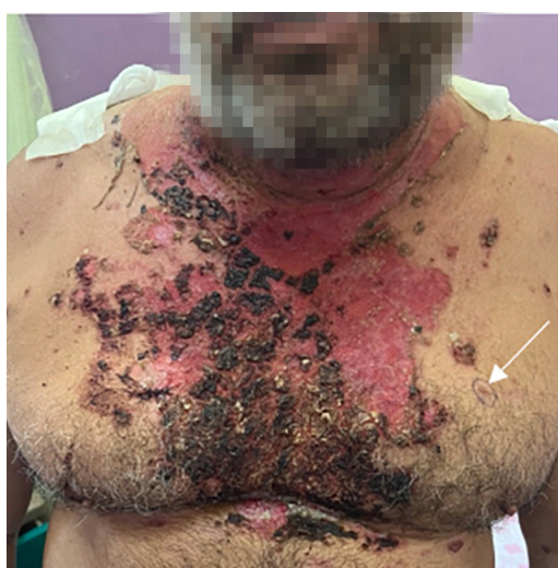
Figura 4. Sitio de toma de biopsia en piel de tórax