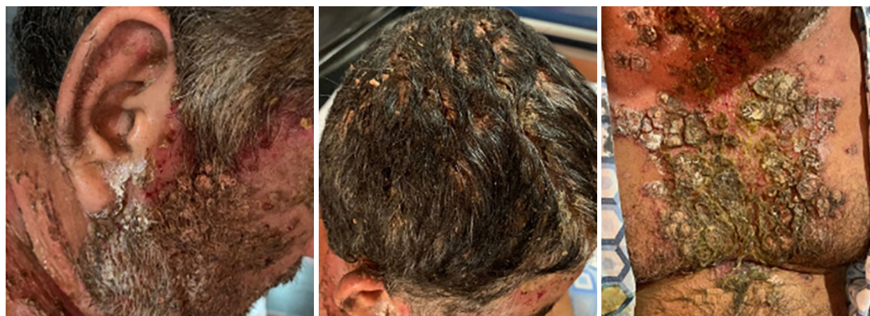
Figura 1. Condición de ingreso de paciente

**U/E HN SJDDSA: Unidad de Emergencia del Hospital Nacional San Juan de Dios, Santa Ana.