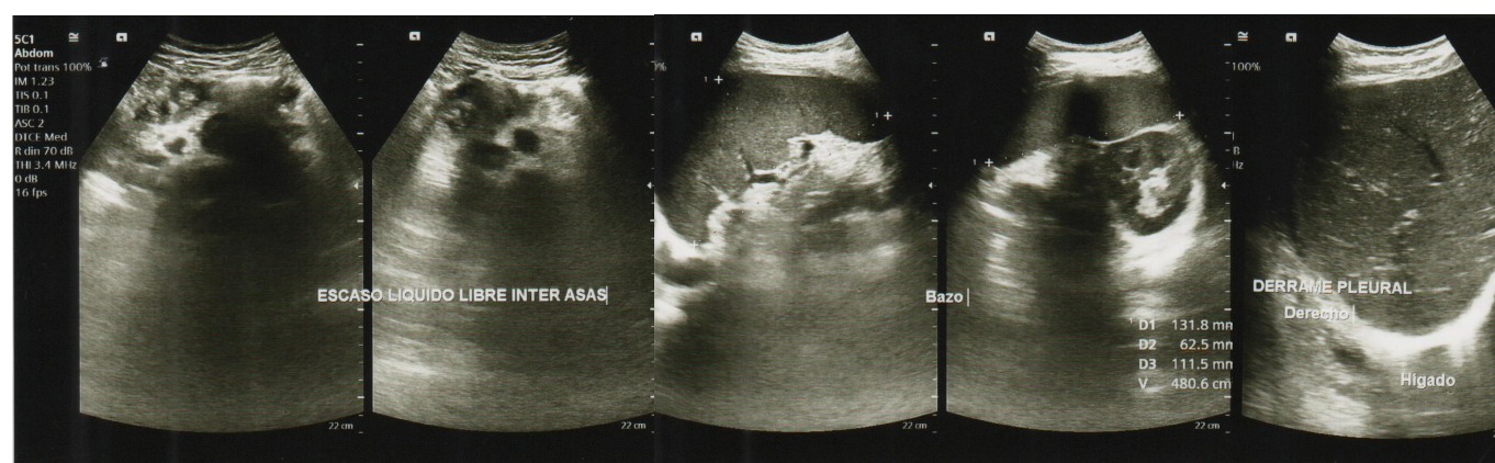
Figura 1. Ultrasonografía abdominal: se observa esplenomegalia, escaso líquido intra abdominal y derrame pleural derecho