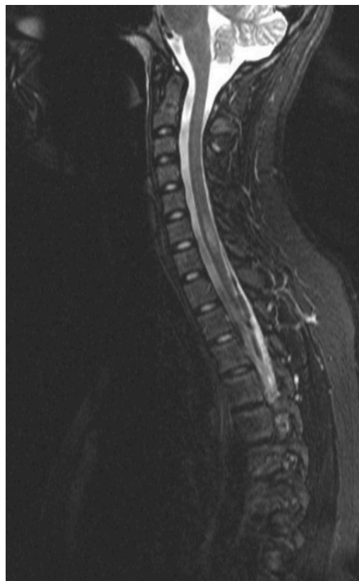
Figura 3. Imagen de resonancia magnética en T2 con alta carga de lesiones infratentoriales (en médula espinal).

En 1954, Kurtzke desarrolló la primera escala para evaluar la discapacidad física en pacientes con EM, denominada Escala de Estado de Discapacidad, compuesta por ocho sistemas funcionales, que incluyen piramidal, cerebeloso, tronco cerebral, sensorial, vejiga-intestino, visual, cerebral o mental, y otros. Cada sistema funcional tiene una ponderación que oscila entre «0» (ha-