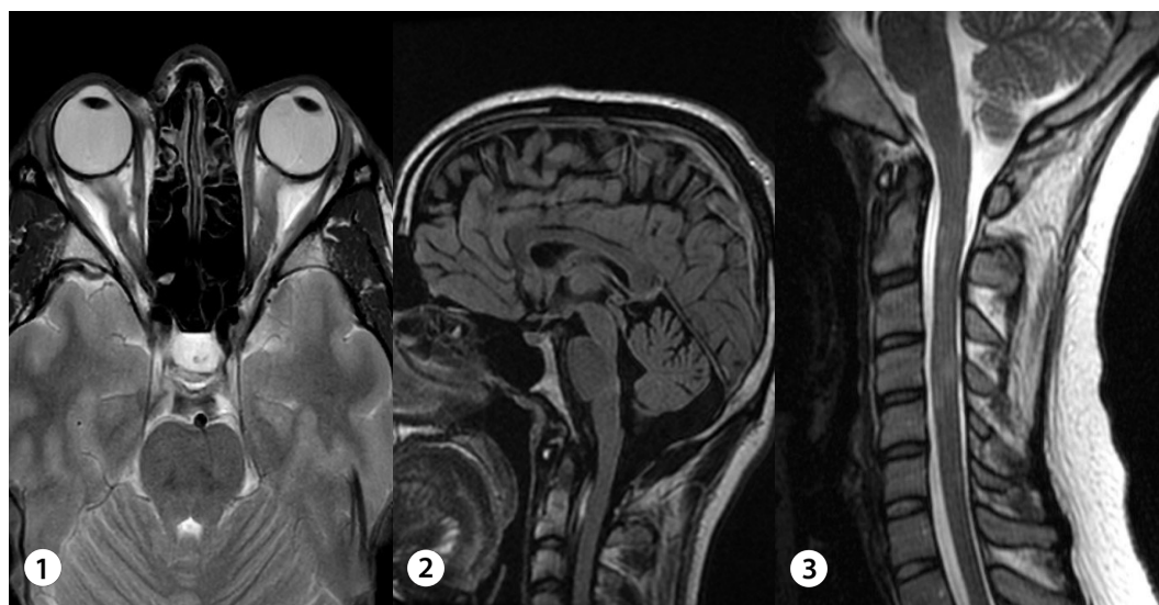
Figura 1. Lesiones desmielinizantes en imágenes T2 de Resonancia Magnética. 1. Nervio óptico. 2. Tronco encefálico. 3. Médula espinal.