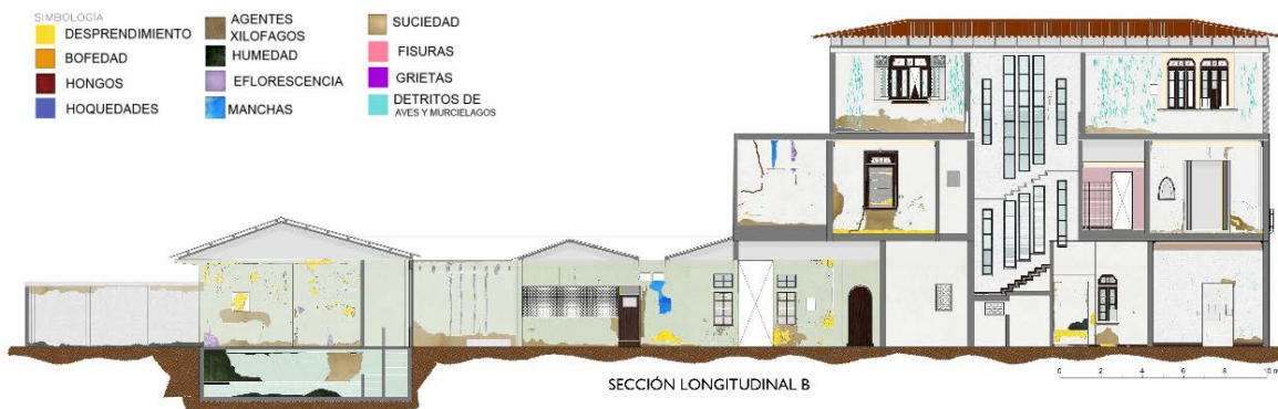
Figura 12: Sección longitudinal B.

Dentro del estudio de la Casa Museo Julio Cortázar, quedaron pendiente aspectos por resolver y que se vuelven una limitante para la obtención de mayores alcances en esta investigación, pero que se reconocen como esenciales para este y otros inmuebles con características similares, entre estos destacan el uso de aparatos tecnológicos como georradar, escáner láser y generación de ortofotos, que habrían permitido profundizar en el análisis de la edificación.