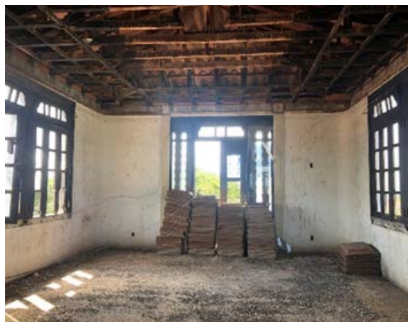
Figura 10: Tercer nivel Casa Muse Julio Corteza.

Por último, el tercer nivel , presenta como mayor problema la presencia de palomas y murciélagos, los cuales ingresan a la vivienda a través de las puertas y ventanas que se encuentran en mal estado; los paños de vidrio de estos elementos se encuentran rotos en su mayoría, algunas de las hojas de las ventanas y puertas han colapsado, y las otras partes presentan daños significativos producto de la presencia de agentes xilófagos, los factores climáticos y el paso del tiempo. El piso de este nivel tiene una capa de detritos de palomas y murciélagos que se ha acumulado con el paso de los años, esto ha permitido que el piso vaya perdiendo su color por los ácidos que contiene las heces de estos animales, fenómeno que también es notable en las paredes del inmueble.