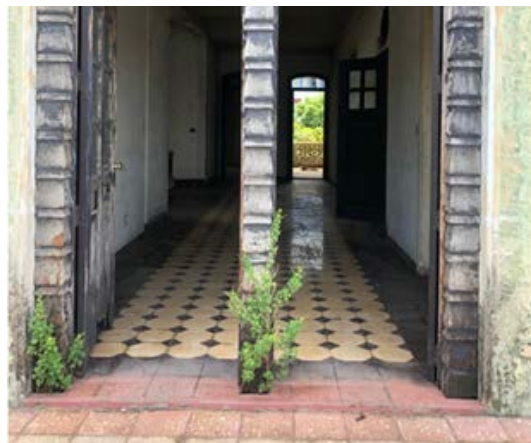
Figuras 6: Puerta, Casa Museo Julio Cortázar. Fuente: Baltodano y Torres, 2020, Figuras 7: Ventana, Casa Museo Julio Cortázar. Fuente: Baltodano y Torres, 2020; Figura 8: Puertas Casa Museo Julio Cortázar. Fuente: Baltodano y Torres, 2020.