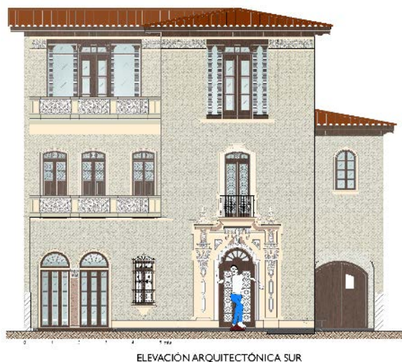
Figura 4: Elevación principal Casa Museo Julio Cortázar.