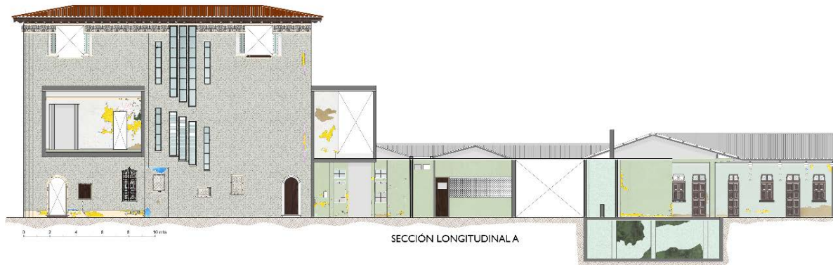
Figura 11: Sección longitudinal A.