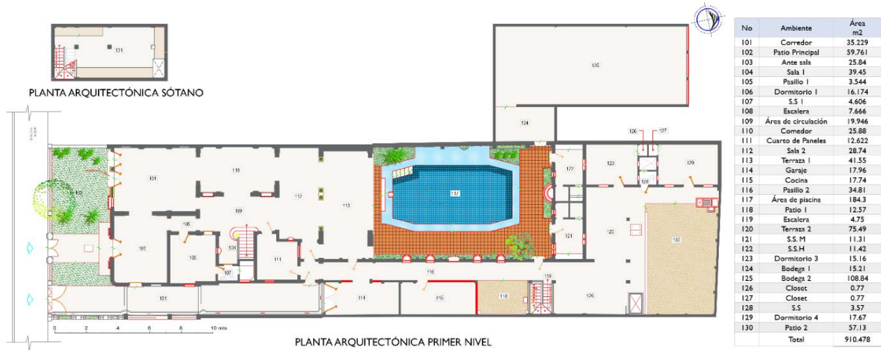
Figura 5: Planta arquitectónica sótano y primer nivel. Fuente: Baltodano y Torres, 2020

El sótano (ver figura 5), en total abandono, se identifica gran cantidad eflorescencia, hongo negro y polvo; a pesar de ello los elementos estructurales se encuentran en condiciones favorables.