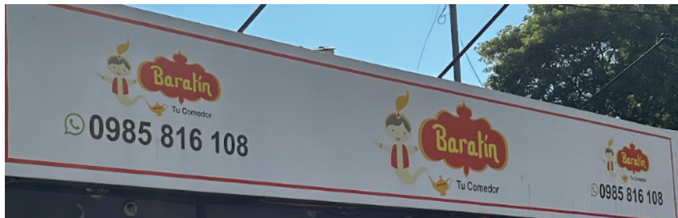
Rótulo comercial en español. Ciudad de Lambaré, departamento Central, Paraguay