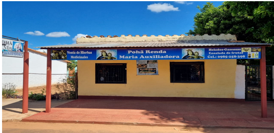
Rótulo comercial híbrido español guaraní. Barrio Piro’y, Capiatá, departamento Central, Paraguay