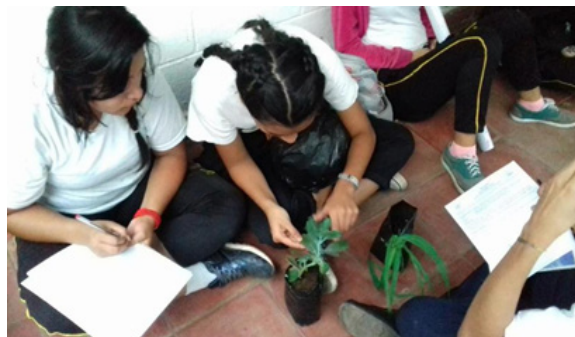
Figura 11. Estudiantes realizando el trabajo práctico experimental

El huerto escolar es una herramienta pedagógica que tiene un fuerte componente social, y permite a su vez la interacción de los alumnos con toda la comunidad educativa. Es por ello que el desarrollo de esta investigación no solo favoreció el proceso de enseñanza apren-