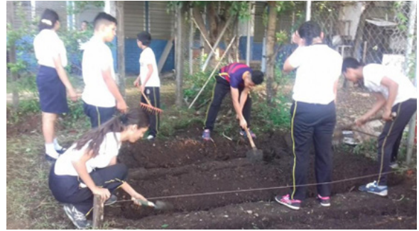
Figura 3. Estudiantes trabajando en la identificación y preparación del suelo del cultivo asignado.

Las actividades realizadas correspondieron a los ocho temas asignados a los grupos de estudiantes por sección. Todo el proceso para la implementación de un huerto se encuentra estipulado en los lineamientos dados por el Ministerio de Educación de El Salvador, y que se detallan en el plan de trabajo del proyecto: “Del huerto al emprendimiento” desarrollado para el Centro Escolar INSA (ver figura 5).