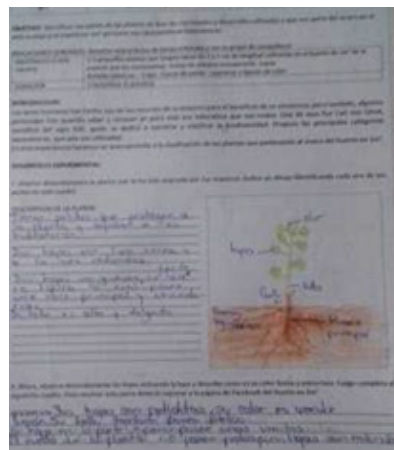
Figura 12. Hoja de práctica experimental que muestra los resultados encontrados por estudiantes.