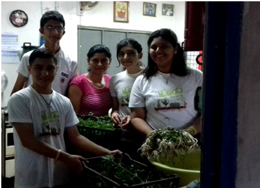
Figura 4. Líderes de sección entregando la cosecha del huerto a la responsable de cocina del centro escolar.