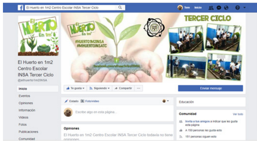
Figura 13. Muestra de la página creada en Facebook para divulgar los resultados educativos de “El huerto en 1m 2 ”.

Con respecto a la primera intervención realizada, correspondiente al trabajo de campo en el huerto, el inconveniente presentado fue la falta de recursos y herramientas que facilitaran el trabajo práctico; además de la apatía por el trabajo en grupo y la puesta en práctica del aprendizaje competitivo y no cooperativo. Esto fue evidente en el caso particular de octavo grado sección B; no obstante, se tomaron las medidas necesarias (cambio en los grupos, delimitación de reglas y normas; establecimiento de fechas límites para la entrega se-