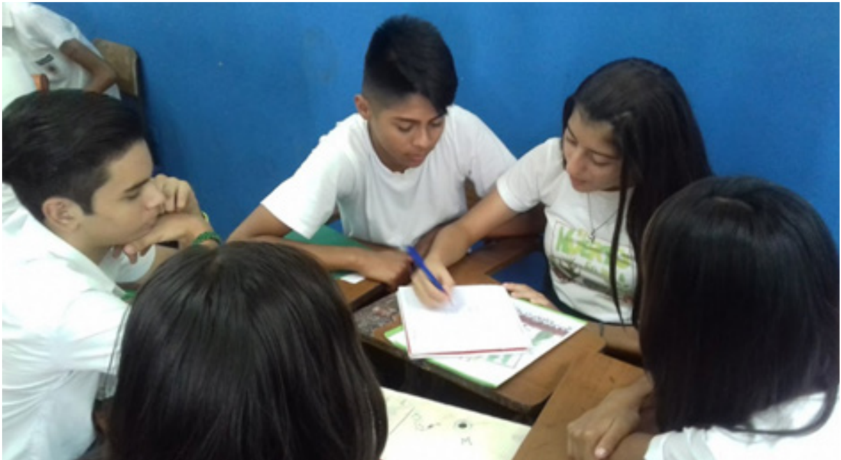
Figura 1. Líder de grupo y sección coordinando las diferentes tareas del proceso investigativo y práctico del huerto.