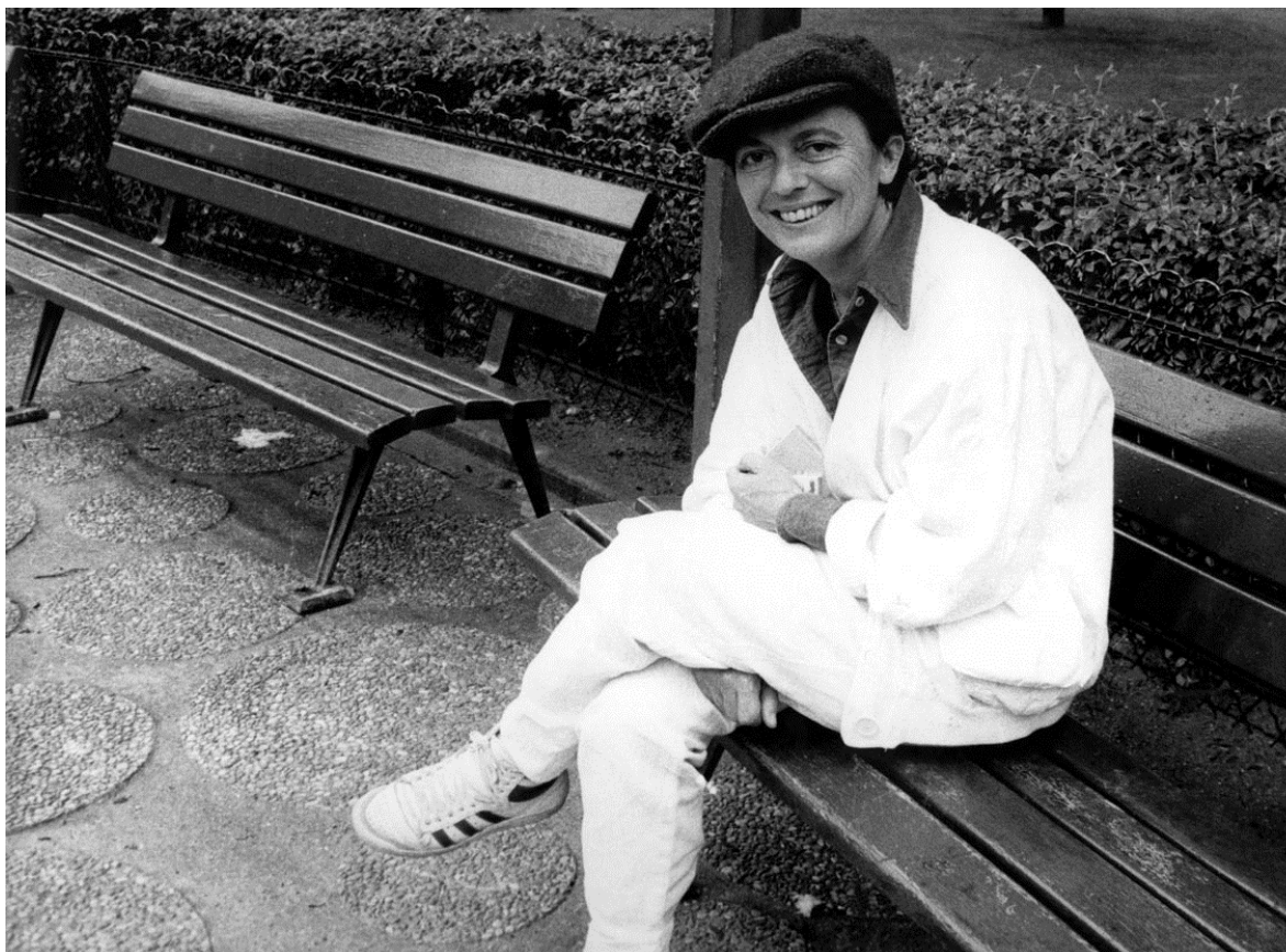
La filósofa francesa Monique Wittig.

Monique Wittig concluye y enfatiza que esta heterosexualidad obligatoria para las mujeres las conmina al silencio, a mandatos propios de esta categoría y exhorta a la ruptura de esta heterosexualidad obligatoria para alcanzar la utopía del contrato social que respete la libertad de cada individuo para alcanzar el bien común: