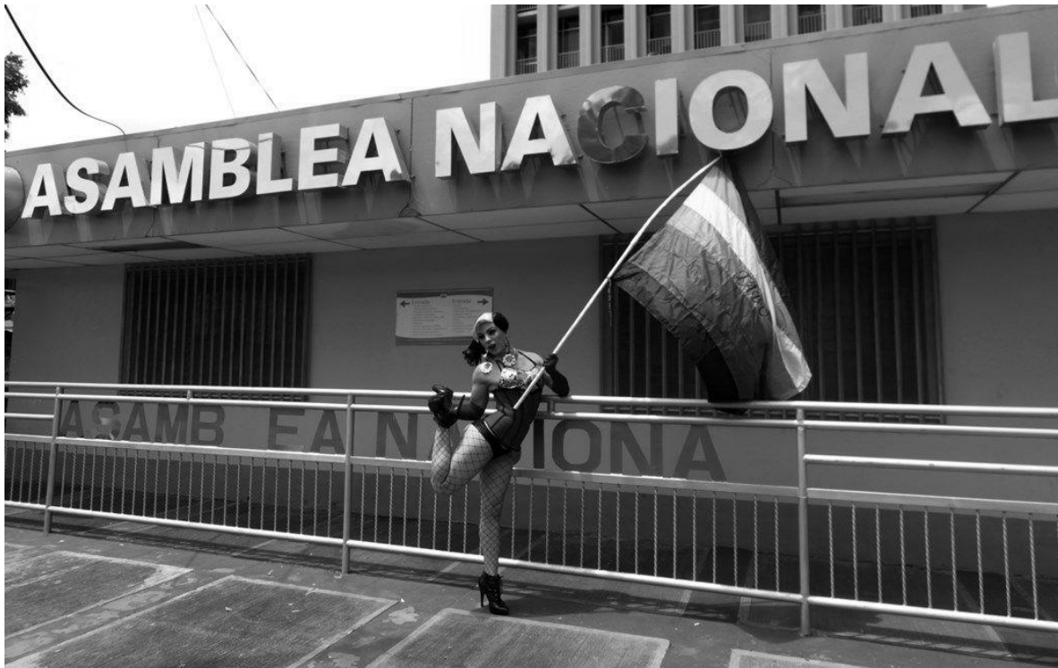
Activista LGTBI presente en las protestas que la comunidad realizó mientras la Asamblea Nacional discutía el Código de Familia, vigente desde 2015. El Parlamento no incluyó ninguna disposición expresa a favor de los matrimonios o uniones homoparentales.

Es así que desde la misma definición de familia el Estado nicaragüense excluye tajantemente a sus ciudadanos que no forman parte de esa definición estrecha, añeja y tradicional de familia que no responde absolutamente en nada a la realidad. En ese sentido, el único contexto al que responde esta definición y lo único que demuestra es la falta de voluntad del Estado nicaragüense de incluir a su población LGBT (Lesbianas, gays, bisexuales y Trans), perpetuando y legalizando a través de la desprotección, la homo-lesbo-trans-fobia.