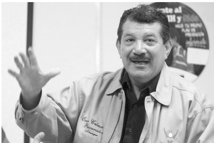
El ex procurador de derechos humanos, Omar Cabezas, abogó por la aprobación del matrimonio igualitario mediante su inclusión del Código de Familia.

creo, otra función; en cierto modo, es el punto cero donde los diferentes sistemas disciplinarios se enganchan entre sí (...) La mejor prueba es que, cuando un individuo es rechazado de un sistema disciplinario por anormal, ¿dónde lo envían? A su familia. Cuando es sucesivamente rechazado de varios sistemas disciplinarios por inasimilable, indisciplinable, ineducable, toca a la familia tomarlo a su cargo; a su vez, la que tiene el papel de rechazarlo por ser incapaz de