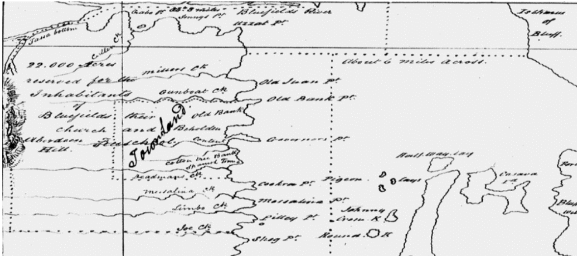
La ilustración muestra el bosquejo de la tierra colectiva otorgada por el Rey Miskito Robert Charles Frederick a la comunidad Creole de Bluefields, 1841

para todos los esclavos estimándose 4 acres para cada uno y también teniendo criterios de moralidad al otorgar solamente la mitad, a los hijos ilegítimos de lo entregado a los hijos legítimos. También hubo una designación para lo que sería el hospital, la escuela y la iglesia, todo en el título colectivo (Goett, 2006, p.161).