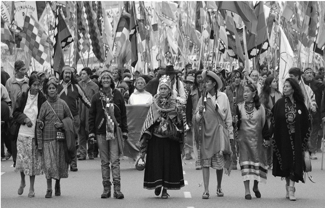
Indígenas de Argentina esperan ser reconocidos por nuevo Gobierno | sputniknews

Reconocer la preexistencia étnica y cultural de los pueblos indígenas argentinos. Garantizar el respeto a su identidad y el derecho a una educación bilingüe e intercultural; reconocer la personería Jurídica de sus comunidades, y la posesión y propiedad comunitarias de las tierras que tradicionalmente ocupan; y regular la entrega de otras aptas y suficientes para el desarrollo humano; ninguna de ellas será enajenable, transmisible ni susceptible de gravámenes o embargos. Asegurar su participación en la gestión referida a sus recursos naturales y a los demás intereses que los afecten. Las provincias pueden ejercer concurrentemente estas atribuciones (Argentina, Congreso General Constituyente, 1994, Ley N° 24.430, art. 75).