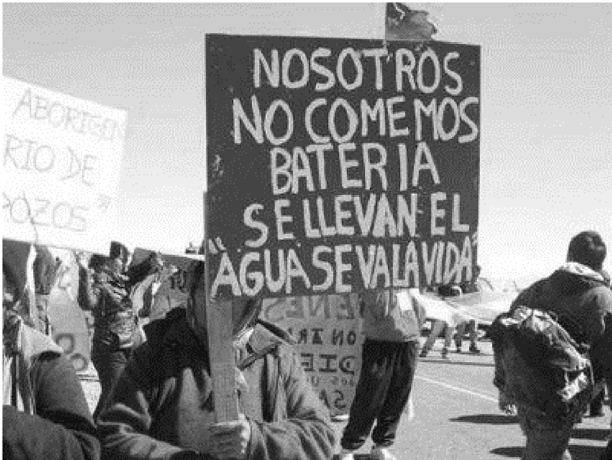
Jujuy entregó 90 mil hectáreas a minera de litio por encima de las comunidades | biodiversidadla.org

postergación de la observancia del marco normativo vigente. En ese sentido, el DPN afirma haber recibido denuncias sobre la falta de consulta previa, libre e informada en la planeación del recorrido del Rally Dakar en sus ediciones de los años 2014 y 2015 (Defensor del Pueblo, 2016, p. 40). Como resultado, la circulación de los vehículos participantes en la competición terminó provocando la mortandad de animales, el daño de viviendas, la destrucción de caminos comunitarios, y la afección del modo de vida de los pueblos indígenas de la zona (Defensor del Pueblo, 2016, pp. 40-41).