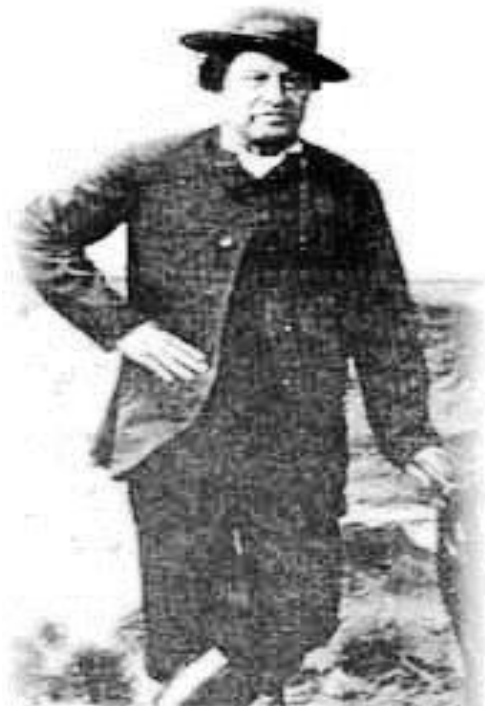
El lonco Valentín Saybueque, uno de los principales comandantes de las fuerzas mapuches durante la Conquista del desierto.

Había llegado el momento para finalmente buscar el progreso. Esa finalidad demandaba poner en orden la propia casa, y la nueva organización institucional del país respondía a ese objetivo. Todo rezago del bando derrotado, sería eliminado o puesto al servicio del plan nacional de Buenos Aires. Los caudillos, los gauchos, los indios, el campo y la identidad americana serían remplazados por los dirigentes porteños, los inmigrantes europeos, el puerto, y la identidad blanca y europea. Se buscaba abandonar la minoría de edad, y avanzar hacia la madura adultez moderna (Dussel, 1994).