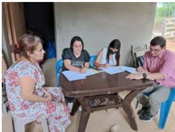
Figura 3. Visita a protagonista de Santa María, Nueva Segovia

Las y los estudiantes y docentes que participaron en este Programa de Fortalecimiento a Emprendedores, a su vez, también fortalecieron sus conocimientos, habilidades, actitudes y valores, adquiriendo los docentes tutores competencias para conducir diferentes modalidades de prácticas educativas y los estudiantes fortaleza en aprendizajes situados y experimental basados en proyectos, que demandó capacidad para resolver problemas y aportar soluciones, generando un aprendizaje significativo en su formación profesional. Mediante estas pasantías, los estudiantes y tutores acompañaron en el mejoramiento de los procesos de emprendimientos y en la elaboración técnica de Planes de Negocios (figura 6, 7 y 8).