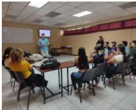
Figura 1. Convocatorias pasantes 2023

El perfil de los estudiantes (figura 2), es un elemento importante en el proceso, pues da la base de conocimientos para cumplir con los objetivos. Se consultó la opinión de los pasantes sobre las asignaturas que le dan las competencias para cumplir el objetivo, a lo que un pasante de ingeniería industrial comparte: "Ingeniería Económica, mercadotecnia, contabilidad básica de costos y contabilidad gerencial" (Escoto Calderón, comunicación personal, 31 de enero de 2024). Pasante de ingeniería agroindustrial indica: "Ingeniería Económica Contabilidad, Marketing y publicidad" (Rugama Montenegro, comunicación personal, 31 de enero de 2024). Pasante de ingeniería de sistema comenta: "Ingeniería económica, Finanzas, Organización, Manufactura, Contabilidad, Mercadotecnia, Metodología de la investigación, Formulación y evaluación de proyectos y Administración de Proyectos" (Videa Martínez, comunicación personal, 06 de febrero de 2024).