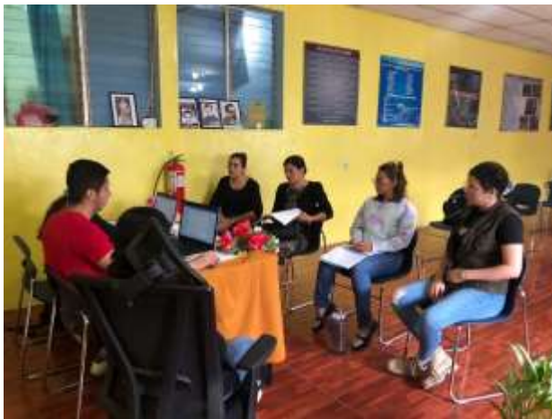
Figura 5. Visita a protagonista de San Nicolás, Estelí.

Los pasantes con sus conocimientos adquiridos desde su curriculum universitario aportaron de manera significativa a la construcción de cada uno de los capítulos que requiere el plan de negocio, como se mencionó anteriormente, a pesar de que los rubros a los que se dedican los emprendedores no coinciden con el perfil profesional de la carrera, se buscaron estrategias para minimizar dicha deficiencia, por ejemplificar: los pasantes contextualizaron el rubro, se apropiaron de algunos términos y técnicas que caracterizan a los emprendimientos acompañados.