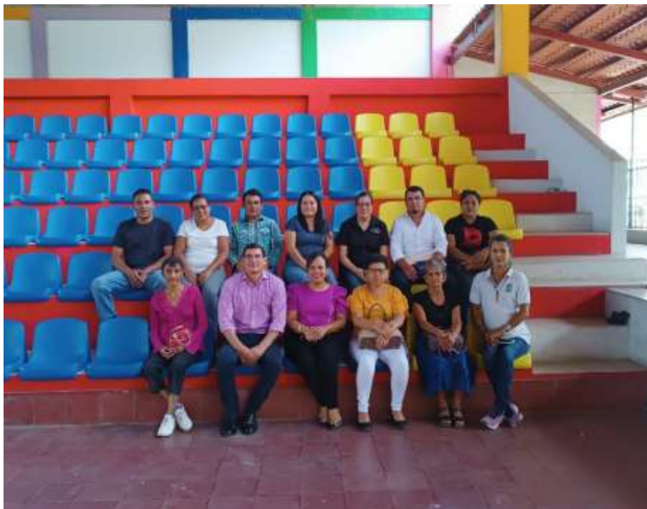
Figura 2. Encuentro con protagonistas