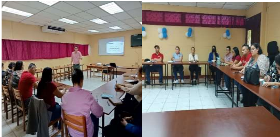
Figura 2. Taller de inducción a tutores

Con la finalidad de que los tutores se apropiaran de los objetivos del programa, alcances, perfil y distribución de los protagonistas por grupos de trabajo para el proceso de desarrollo de las pasantías (tabla 1), las fases para la construcción del plan de negocio y la metodología, fueron impartidos los talleres de inducción, rescatando las palabras de Narvaéz (2024) “Fue muy provechoso los talleres y el compartir los distintos puntos de vista y aportes para el desarrollo de las pasantías”.