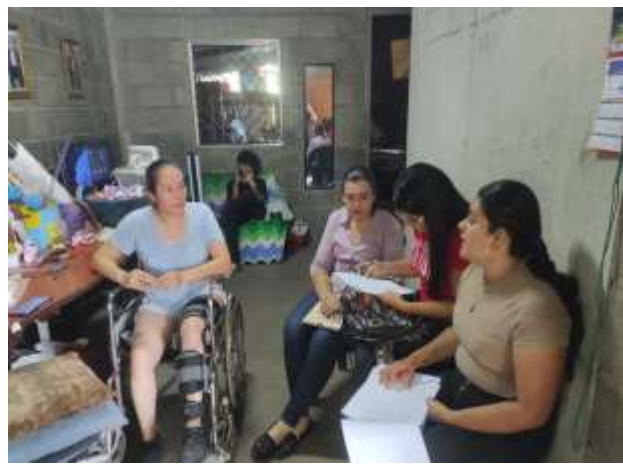
Figura 5. Visita a protagonista de Santa María, Nueva Segovia.