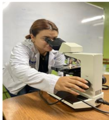
Figura 1. Identificación de insectos plagas a través del microscopio.

Se llevaron al laboratorio para hacer uso del microscopio y determinar la familia y el orden al que pertenecen, identificando el tipo de alas, patas, antenas, aparato bucal y/o demás características haciendo uso de las claves dicotómicas, figura 1.