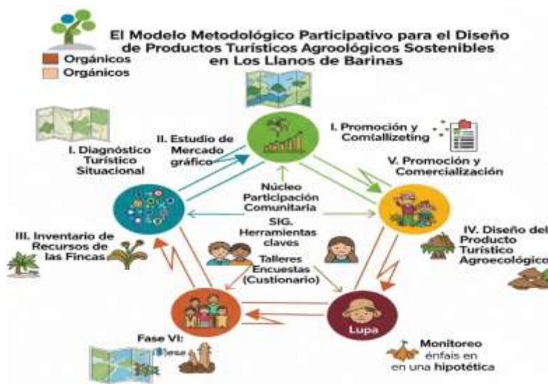
Figura 1. Modelo metodológico participativo

El diseño de productos turísticos, particularmente aquellos que buscan un impacto positivo en las comunidades locales y el medio ambiente, requiere un enfoque meticuloso y participativo en cada una de sus fases (figura 1). Desde el diagnóstico inicial hasta el monitoreo continuo, la integración de la comunidad y la consideración de sus necesidades y expectativas son fundamentales para garantizar el éxito a largo plazo y la sostenibilidad del producto. Este proceso, basado en investigaciones y experiencias recientes, abarca diversas etapas, cada una con sus propias herramientas y metodologías, todas ellas interconectadas y orientadas a la creación de una oferta turística responsable y atractiva.