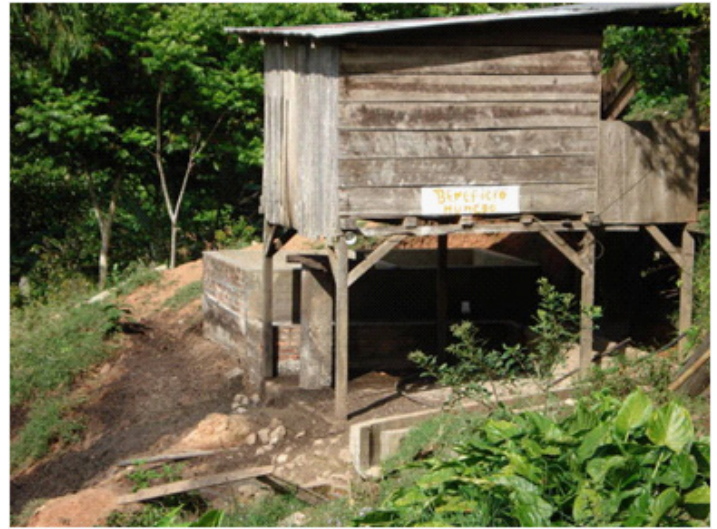
Beneficio húmedo en finca