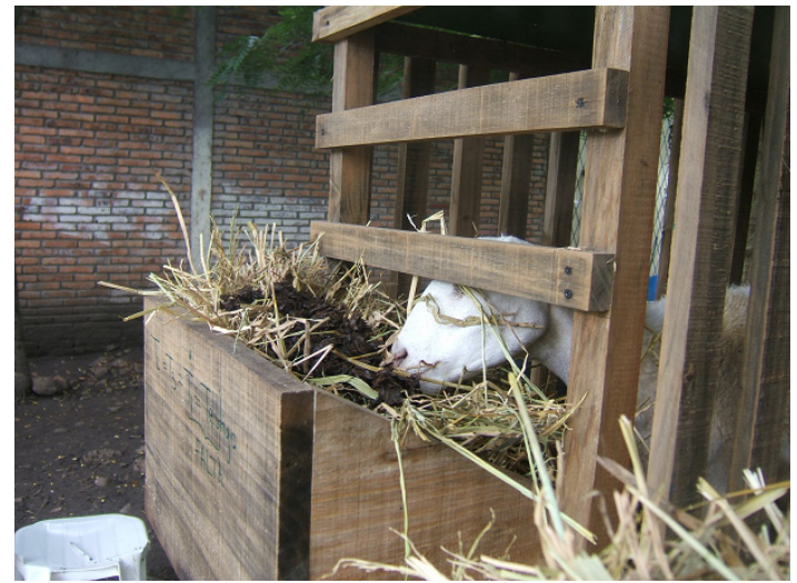
Pelibueyes alimentándose con pulpa de café ensilada y paja de arroz