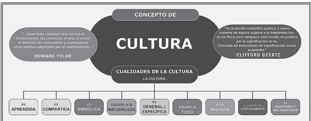
Figura 1. Cualidades específicas asignadas al concepto de cultura. [Elaboración propia con base en el planteamiento de Kottak (2011), complementado con el concepto de Geertz expuesto en Barfield (2000)]

En la figura 1 se puede ver cómo se exterioriza la creación patrimonial. Mapa conceptual de elaboración propia, a partir de lo propuesto por Kottak (2011).