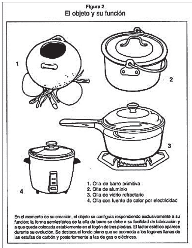
Figura 2. El objeto y su función (Cruz, 2001)

Efectivamente, cada objeto es un documento portador de información o el mensaje producto de una serie de acciones intencionadas, o modos de huellas de la actividad humana, como el uso al que fue destinado, la materia con la que está elaborado, su forma, su decoración, entre muchos otros aspectos (Cruz, 2001).