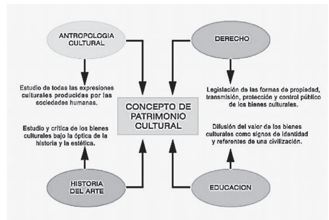
Figura 4. Abordaje del concepto desde diferentes disciplinas del conocimiento. Propuesto por Lull Peñalba (2005), citado por Consuegra & Albayero (2012), citado por Consuegra & Albayero (2012).

En segundo lugar, y no menos importante, por encontrarse vinculado estrechamente con el patrimonio etnológico, se halla el patrimonio viviente. Este patrimonio se refiere al hecho de que, las personas están dotadas de un espíritu creador, que es su capacidad distintiva, la que los diferencia de los otros organismos vivos. Ese es el milagro de la vida humana. Por lo que es importante destacar que las distintas expresiones, manifestaciones y creaciones, como la música, la danza, la lengua, los ritos no existen físicamente y son los elementos intangibles tradicionales utilizados por quienes protegen y preservan el patrimonio cultural material, considerándose en virtud las técnicas para reparar instrumentos musicales tradicionales, o para trabajar sillares en monumentos antiguos, o para consolidar y restaurar techos con métodos y utensilios tradicionales, entre otros. Por ello, la Unesco considera a dichas personas como "Tesoros Humanos Vivientes", puesto que encarnan y poseen en su grado más alto las habilidades y técnicas necesarias para la producción de los aspectos seleccionados de la vida cultural de un pueblo y para la existencia continua de su patrimonio cultural material (Albayero, 2016).