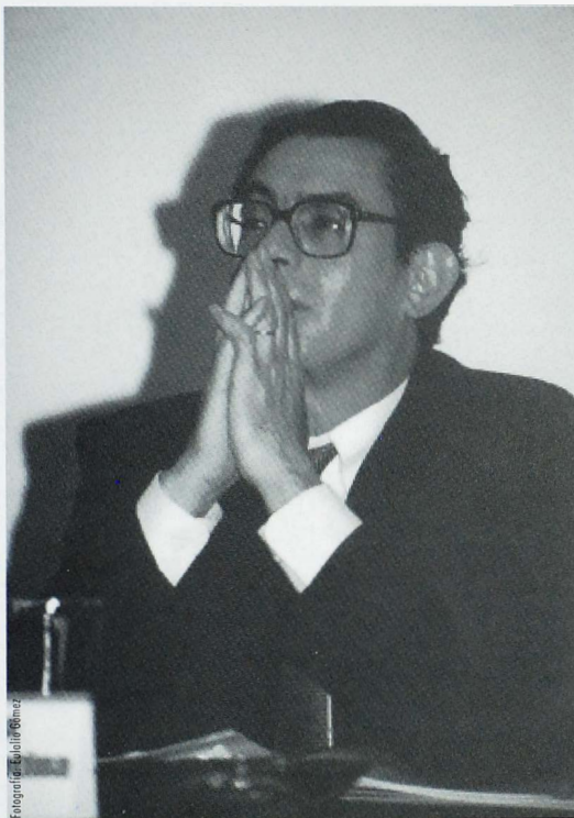
Jorge Pereira, Embajador de la República de Argentina.

Aprovecho ahora para hacer otra aclaración a diferencia por ejemplo con el Tratado de Libre Comercio de Norte América (NAFTA) u otra agrupación similar: el Mercosur negocia sus acuerdos comerciales, los cuatro juntos frente a cualquier país o grupo de países. En el caso de una integración del tipo NAFTA que es un acuerdo de libre comercio, cada país (Estados Unidos, México ó Canadá) negocia con los países o con el grupo de países en forma individual. Es decir es una opción política, nosotros hemos estado por una unión aduanera, lo cual implica que nos tengamos que coordinar previamente para negociar con terceros países.