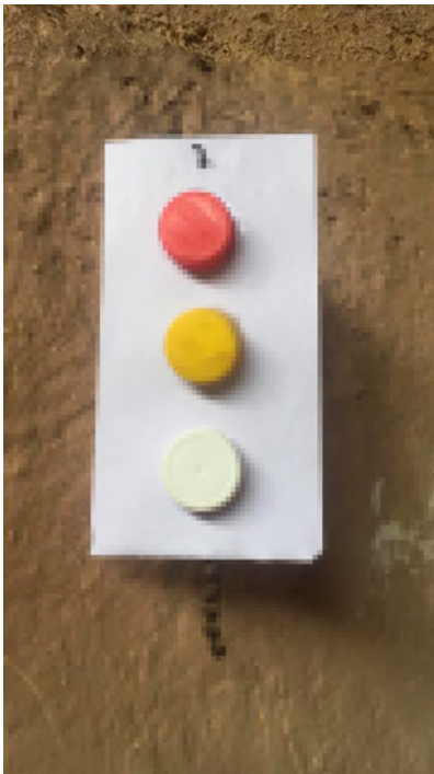
Captadores de contaminación.

En la imagen observamos un experimento para detectar si existe contaminación dentro del hogar. Este experimento consiste en: tomar una hoja de block y cortarla en 3 partes iguales, luego sobre cada uno de los pedazos de hoja colocamos tres tapones, los cuales servirán como detectores de contaminación. El experimento duró 3 semanas, donde se retiraba un tapón cada semana y se realizaba un análisis de los cambios que se presentaban en el papel. La siguiente imagen muestra los puntos de muestreo donde realizamos dicho experimento. A continuación, se describen los resultados obtenidos a partir del experimento, sobre la contaminación del aire y cuál es el punto más afectado.