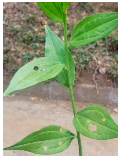
Los agujeros en la planta es otro efecto de la lluvia ácida en El Crucero, Managua.

Finalmente deseo expresarles que en esta experiencia enriquecedora de aprendizaje los estudiantes destacaron lo siguiente: enriquecimos los conocimientos, logramos comprender el objetivo de la Química Ambiental, conocimos ampliamente los tipos de contaminación, comprobamos algunos tipos de contaminación, valoramos nuestro poco tiempo en equipo, aprendimos a trabajar en equipo, respetamos las opiniones de nuestros compañeros y obtuvimos extensas explicaciones de la clase, pero sobre todo muy clara.