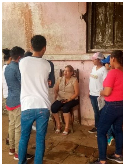
Estudiantes entrevistando a una habitante de El Crucero, Managua.

En las siguientes imágenes se pueden apreciar acciones y observaciones realizadas en esta actividad académica.