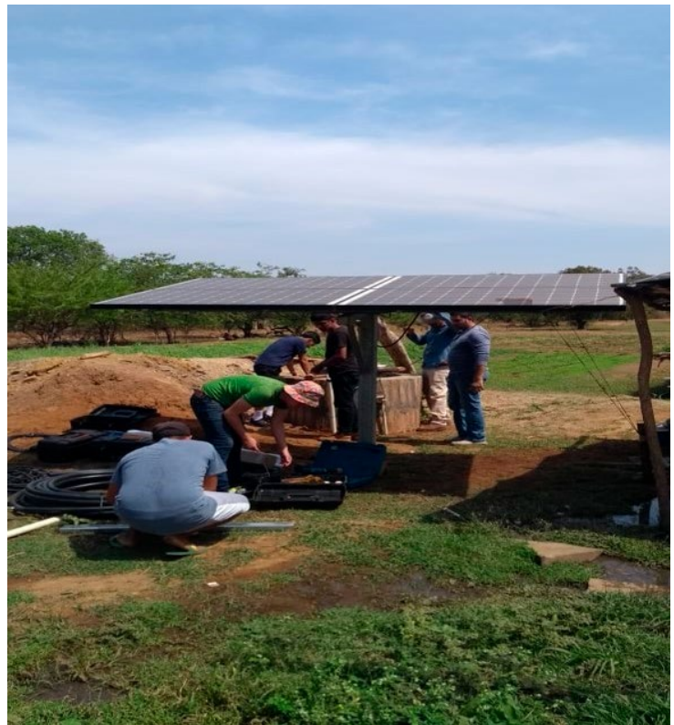
Figura 7. Instalación sistema de bombeo solar fotovoltaico. ENICALSA.