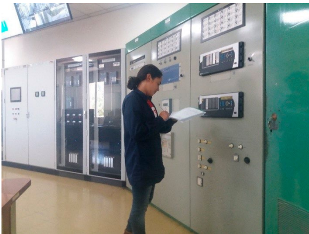
Figura 2. Control y monitoreo de elementos de planta hidroeléctrica Carlos Fonseca Amador.