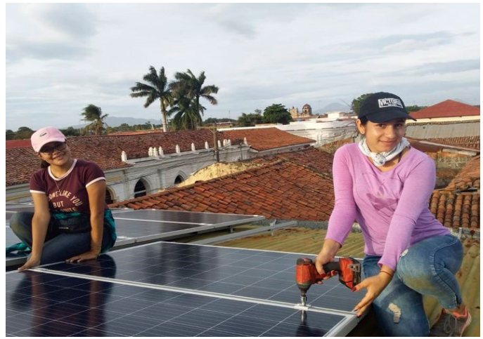
Figura 5. Instalación de sistema fotovoltaico.