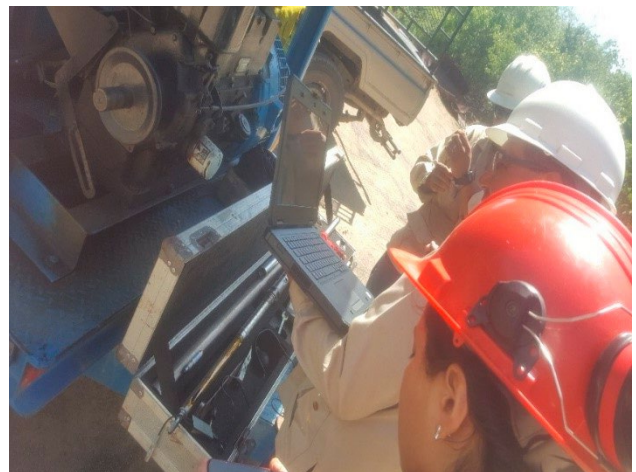
Figura 3. Preparación de registro de presión al pozo 36 de planta geotérmica Momotombo.