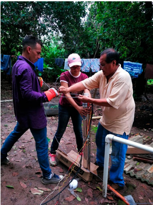
Figura 6. Mantenimiento a bombas. ECOENERGIA.