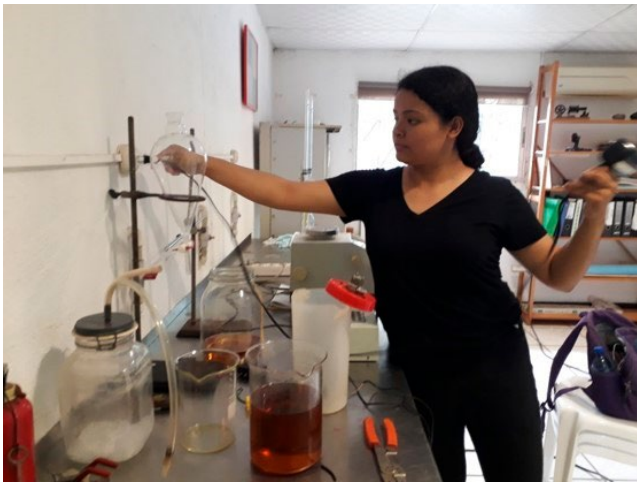
Figura 4. Pruebas de producción de biodiesel. CIDTEA, La Salle.