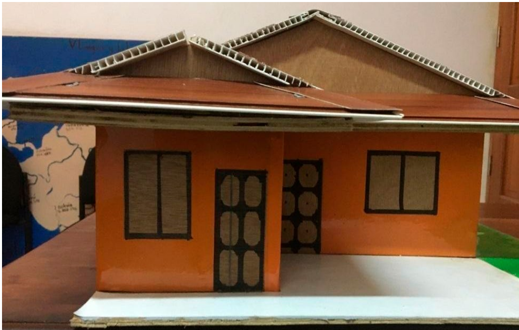
Autores: Estudiantes de Construcción Técnico Medio BICU Bilwi.