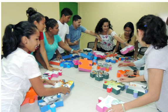
Intercambio de experiencias innovadoras. Jóvenes comparten con estudiantes de otras disciplinas y especialistas

esta forma definir una agenda conjunta, para incursionar en la implementación de talleres comunitarios de Innovación y emprendimiento, realizar videos foros sobre el tema en escuelas secundarias, diseñar un Diplomado de Innovación y Emprendimiento.