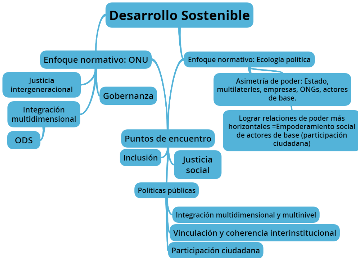
Figura 2: Desarrollo sostenible: enfoque de la ONU y ecología política