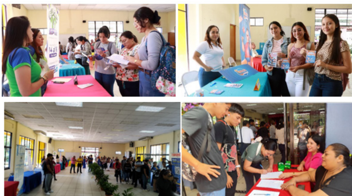
Figura 1. Evidencia fotografía de Feria Laboral 2024

Nota. Registro de estudiantes y participación de empresas e instituciones en la II Feria laboral 2024. Elaborado por los autores.