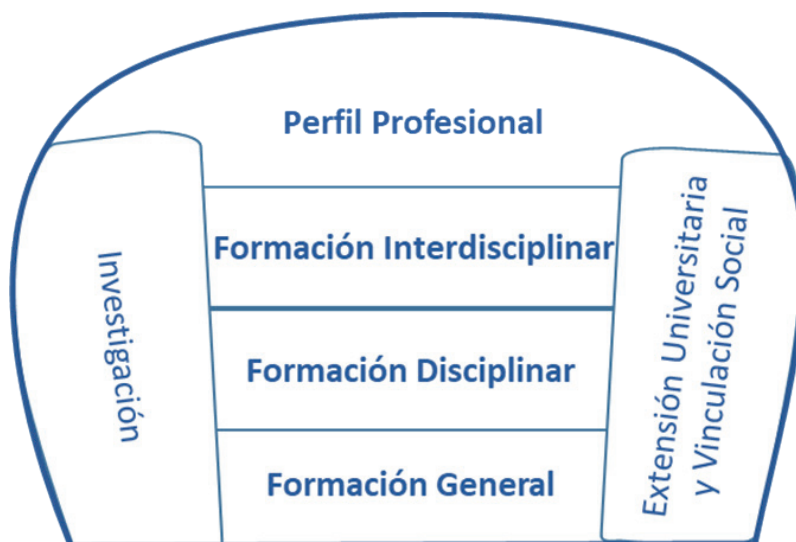
Figura 1. Inclusión curricular de la extensión

Figura 1. El modelo de la inclusión Curricular de la Extensión Universitaria y Vinculación Social. Los diferentes bloques de formación corresponden a la organización del currículo de las carreras de profesorado en la UPNFM. Se considera que la investigación y la extensión universitaria y vinculación social deben ser transversales en el proceso formativo. Fuente: Elaboración propia.