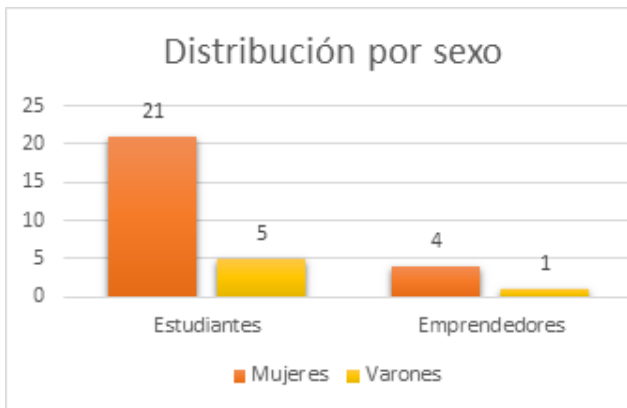
Gráfico 2. Distribución de estudiantes y protagonistas por sexo.

Fuente. Datos suministrados por docentes tutores y responsables territoriales de las Escuelas Municipales de Oficio.