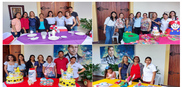
Fuente: Informe de Prácticas y Pasantías en el Programa de Fortalecimiento a los Emprendedores de las Escuelas Municipales de Oficio, FAREM-Carazo.