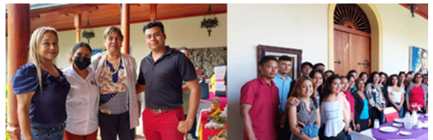
Fuente: Informe de Prácticas y Pasantías en el Programa de Fortalecimiento a los Emprendedores de las Escuelas Municipales de Oficio, FAREM-Carazo.