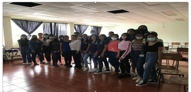
Fig. 1. Estudiantes el primer día de capacitación.