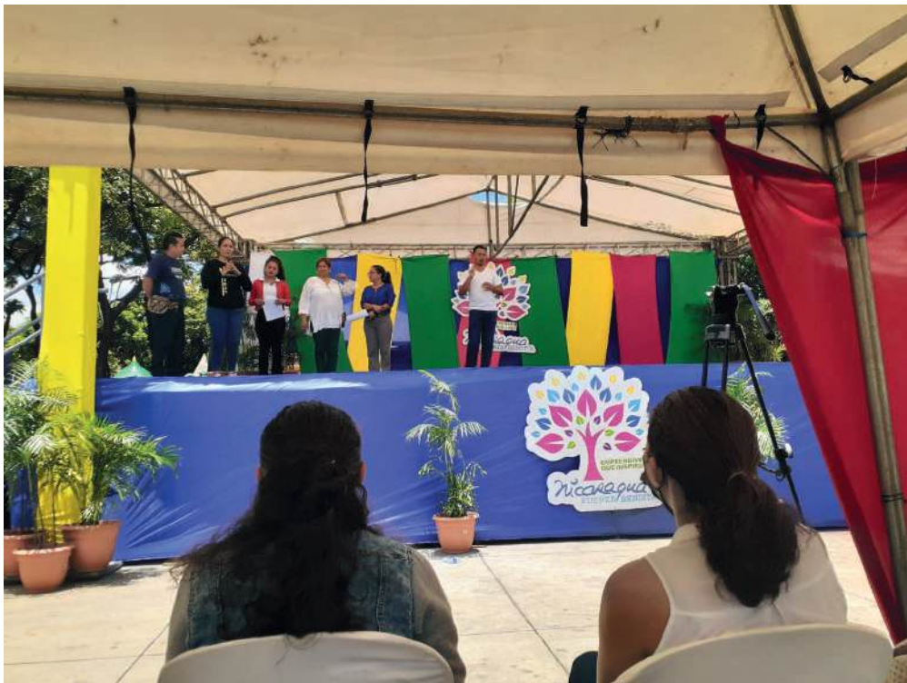
Fig. 31. Presentación del jurado calificador del evento.

A continuación, se presentaron a las/os participantes del Concurso Nacional de Manualidades 2022, así como al jurado calificador y los parámetros a evaluar.