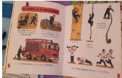
Fig. 21 y 22. Ministerio de Educación (MINED). Material Didáctico personas con discapacidad visual y auditiva: Reloj, simuladores y material de lectura.