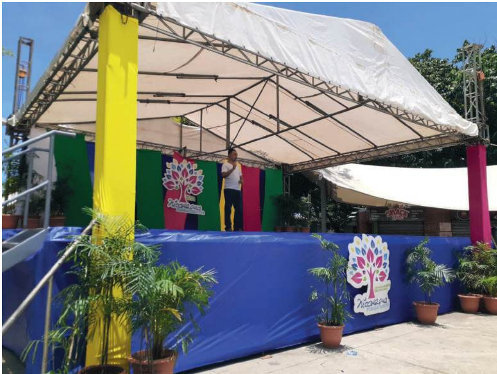
Fig. 32. Presentación de los emprendimientos.

A las diez y cincuenta de la mañana, se procedió a hacer el recorrido y evaluación de las/os participantes del Concurso Nacional de Arte y Manualidades “Manos Laboriosas, Manos que Transforman”.