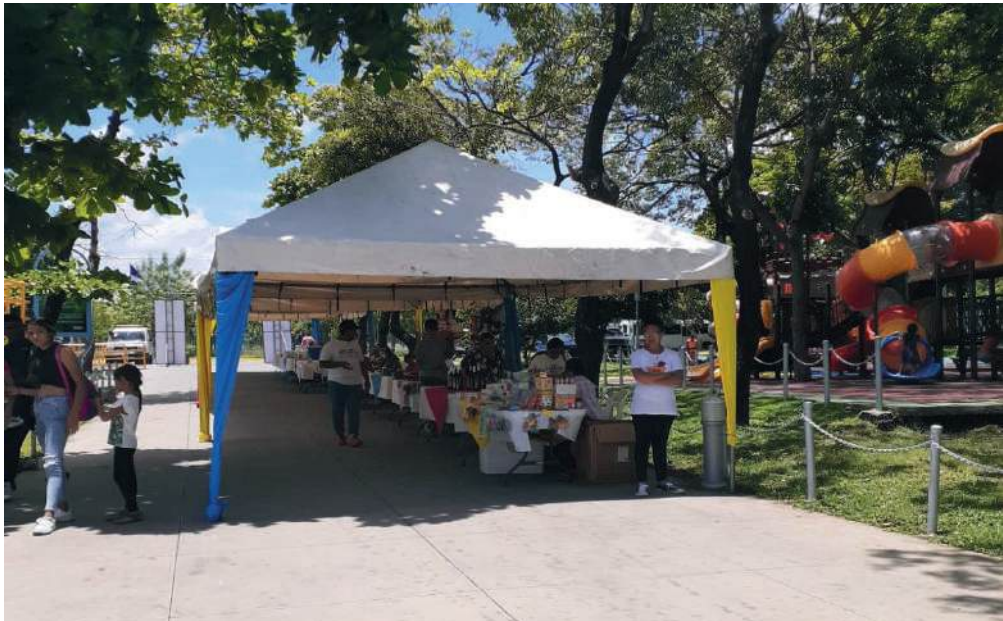
Fig. 3 y 4. Stand de Emprendedores del IV Concurso Nacional de Arte y Manualidades.