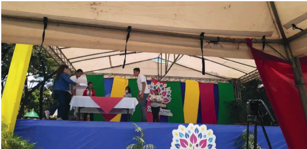
Fig. 36. Demostraciones.

A las once de la mañana se procedió a realizar una entrevista y demostraciones en la tarima sobre la elaboración de artesanías en madera y papel, por parte de las Delegaciones de Managua, Carazo y León.