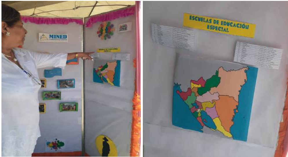
Fig. 8 y 9. Ministerio de Educación (MINED). Ubicación de Escuelas Especiales en Nicaragua.

donde existe un aula de computación de calidad. Todas estas escuelas, están dotadas de material sofisticado para que las/os muchachas/os cuando incursione laboralmente, no se asuste al ver este tipo de materiales.