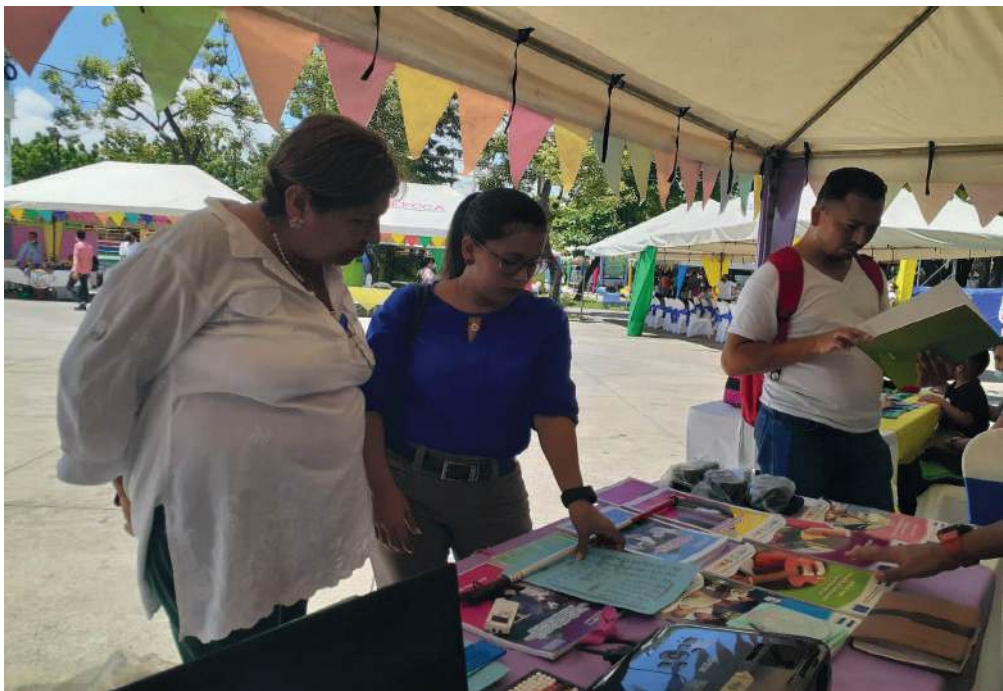
Fig. 5, 6 y 7. Stand de Emprendedores del IV Concurso Nacional de Arte y Manualidades. Ministerio de Educación (MINED). Fuente: Elaboración Propia.