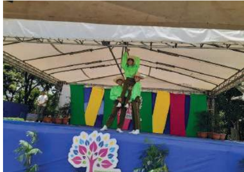
Fig. 33-35. Gala Cultural.