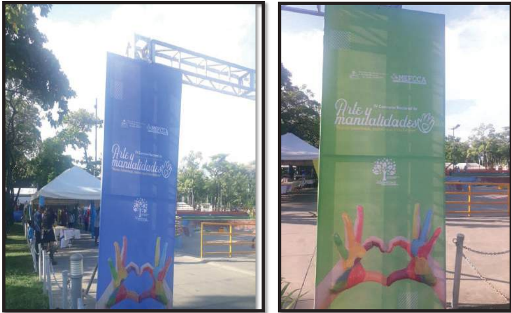
Fig. 1 y 2. IV Concurso Nacional de Arte y Manualidades.

El día sábado 20 de agosto del 2022, en las instalaciones del parque Luis Alfonso Velásquez Flores, en horario de 10:00 a.m. a 4:00 p.m. 3 , se llevó a cabo la IV Edición el CONCURSO NACIONAL DE ARTE Y MANUALIDADES “MANOS LABORIOSAS, MANOS QUE TRANSFORMAN”, en el que participaron protagonistas con capacidades especiales de diferentes departamentos del país, que, a su vez, forma parte del Plan Nicaragua Fuerza Bendita “Emprendimientos que inspiran”, que es una plataforma para la promoción de los emprendimientos liderados por las personas con discapacidad. Este Plan contiene una serie de actividades que fomentan el desarrollo de habilidades,