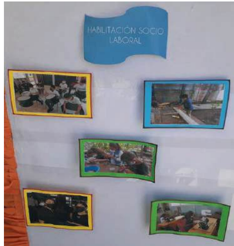
Fig. 10. Ministerio de Educación (MINED). Habilitación Socio Laboral de personas con discapacidad.

La misión de estas Escuelas de Educación Especial es planificar, normar, dirigir y organizar la respuesta educativa de las/os estudiantes con discapacidad, atendidos en la Educación Básica y Media con un enfoque inclusivo, que asegure la igualdad de oportunidades en el desarrollo de habilidades, destrezas y capacidades intelectuales, laborales y morales que les permitan integrarse activamente a la sociedad. Su visión es integrar a la vida comunitaria y a la sociedad a todos las niñas, niños, adolescentes, jóvenes y adultos, mediante la metodología de enseñanza-aprendizaje, adaptados según sus necesidades.