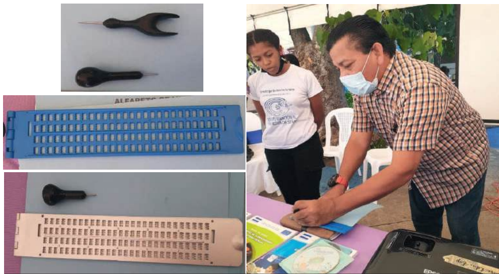
Fig. 16-19. Ministerio de Educación (MINED). Material Didáctico personas con discapacidad visual y auditiva: Regletas y punzones.

De igual forma, las regletas braille , que son un dispositivo que le ayuda a las/os estudiantes para poder escribir en braille toda la información, o un pensamiento que tengan. Lo correcto es que el o la o el estudiante tenga su máquina perkins, pero por su alto costo de $800 dólares nueva, no tiene mucha accesibilidad, puesto que el padre de familia no puede comprarla. Por lo que la regleta braille es la mejor opción para ellos.