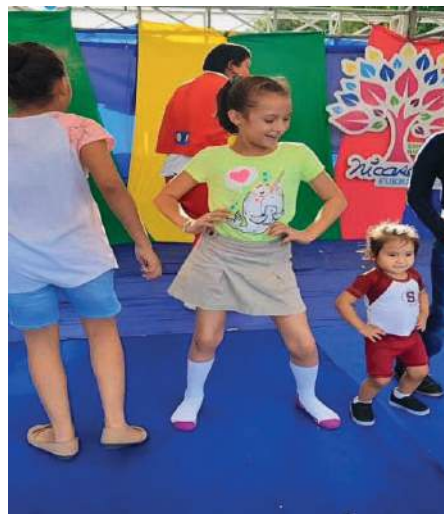
Fig. 37-40. Actividades artísticas y recreativas.