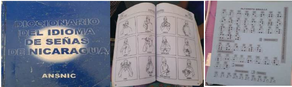
Fig. 13-15. Ministerio de Educación (MINED). Material Didáctico personas con discapacidad visual y auditiva.

De igual forma, las regletas braille , que son un dispositivo que le ayuda a las/os estudiantes para poder escribir en braille toda la información, o un pensamiento que tengan. Lo correcto es que el o la o el estudiante tenga su máquina perkins, pero por su alto costo de $800 dólares nueva, no tiene mucha accesibilidad, puesto que el padre de familia no puede comprarla. Por lo que la regleta braille es la mejor opción para ellos.