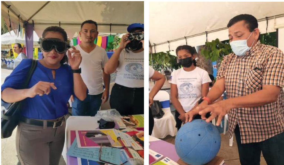
Fig. 23 y 24. Ministerio de Educación (MINED). Material Didáctico y de recreación para personas con discapacidad visual y auditiva: Simuladores y Pelota gol gol.

Las/os estudiantes con discapacidad visual también tienen derecho al deporte, por ello, se implementa el juego de gol gol con una pelota especial, que lleva en su interior un sonajero. El gol gol es un deporte muy divertido, pero muy complejo, cansado. Para su desarrollo, el o la estudiante debe tener mucho oído a la hora de tirar la pelota. Tiene que saber cómo y a qué lado tirarse para poder detener la bola. Debe manejar todas las técnicas. El o la estudiante, se cubre para que no le golpeen la cara, según la posición de la pelota e inmediatamente actúa para echar el gol.