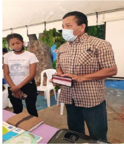
Fig. 20. Ministerio de Educación (MINED). Material Didáctico personas con discapacidad visual y auditiva: Abaco.

Por esa razón, el ábaco es permitido a la hora que un estudiante ciego va a hacer un examen, porque esto les permite realizar un desarrollo mental, un cálculo mental inmenso. Todo procedimiento se hace aquí, no como la calculadora que solo suma dos, más de dos, cuatro. Aquí tengo que saber la posición, las cuentas de arriba valen cinco, las otras valen uno. Este material fue adaptado colocándole una esponja en la parte de atrás, para que la cuenta no se corra como en el ábaco abierto. Las cuentas se pueden mover y jugar con ellas.