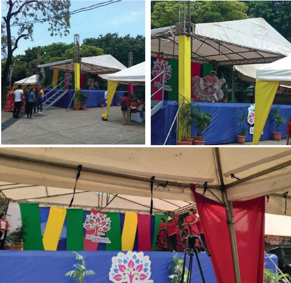
Fig. 28-30. Gala Cultural.