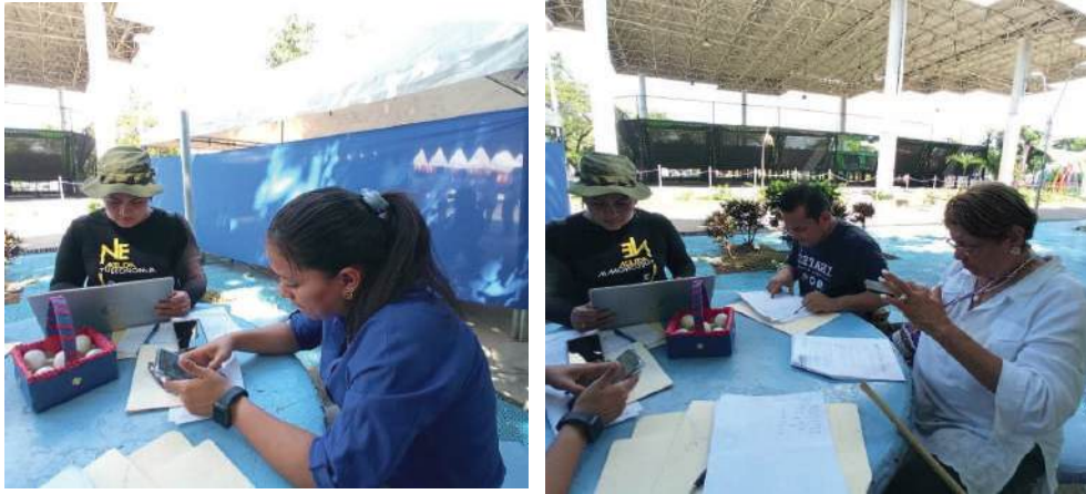
Fig. 41-43. Jurado Calificador en el proceso de elección de las/os ganadores.