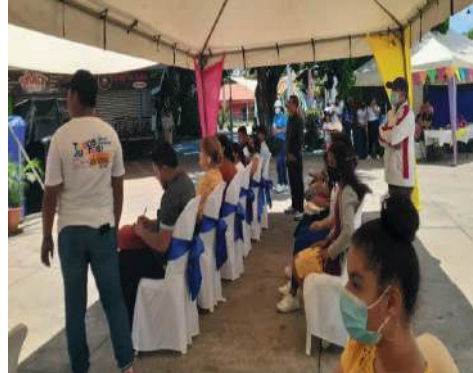
Fig. 25-27. Palabras de bienvenida e inauguración del evento.