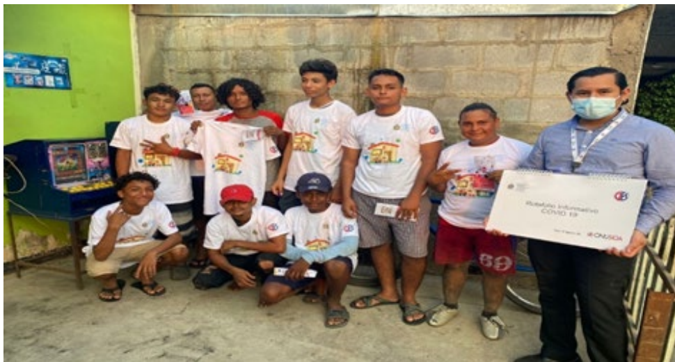
Fotografía 1: Taller con jóvenes de Ciudad Belén.