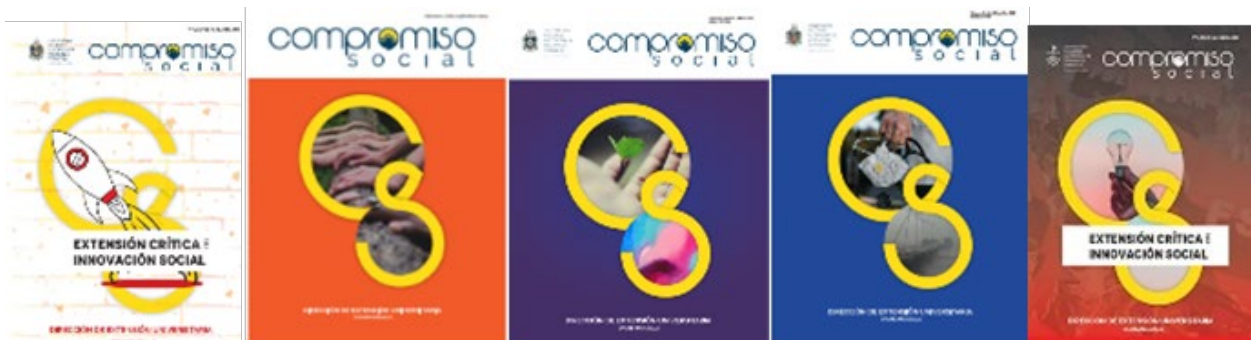
Portadas de la Revista Compromiso Social

En el primer semestre del 2019, nace la Revista Compromiso Social, una publicación de la Dirección de Extensión Universitaria que ininterrumpidamente ha alcanzado con este, 7 números de publicaciones que contienen experiencia de proyectos de intervención social en toda Nicaragua, y ha contado con la colaboración de autores de artículos, tanto de Nicaragua como de distintos países de Latinoamérica.