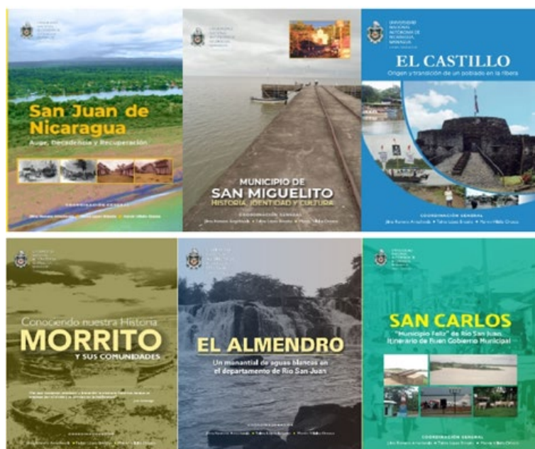
Portada de estudios regionales de los 6 municipios del Departamento de Río San Juan.

Desde el año el año 2018 al 2021, se publicaron una serie de estudios multidisciplinares de los 6 municipios del Departamento de Río San Juan, donde estudiantes, docentes y comunitarios participaron activamente para hacer posible este proyecto de investigación “Un Estudio local para el Desarrollo: Historia del departamento de Río San Juan y sus Municipios”. Lo novedoso de este estudio es que se enfoca en una región de Nicaragua, por muchos años excluidos y olvidados, que en su proceso histórico de conformación le acompañan muchas luchas, es un estudio regional multidisciplinario, incorpora a jóvenes estudiantes con docentes para realizar el trabajo campo y el procesamiento de los datos.