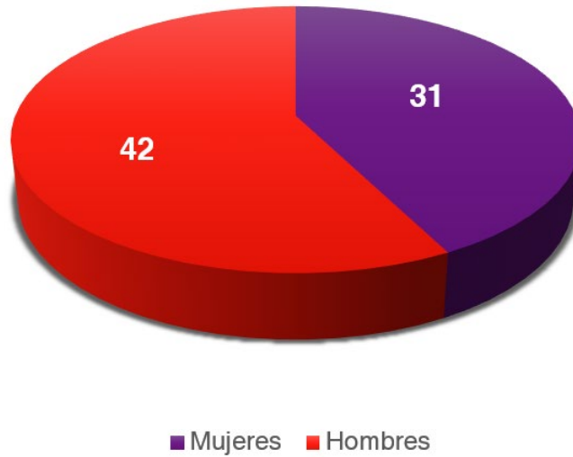
Publicaciones por sexo.

La Editorial Universitaria, atiende la demanda de publicaciones de la comunidad Universitaria (89%), sin embargo, la Editorial atiende las solicitudes de escritores externos que representan el 11%.