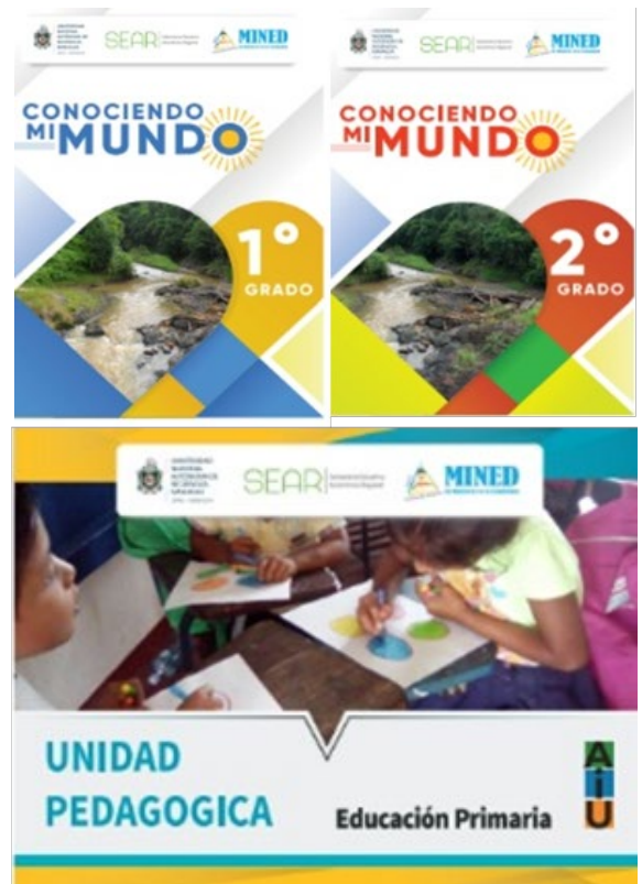
Portadas de libros de textos de primaria, que se realizó la adecuación curricular.

En el año 2018, se publicaron 21 textos escolares, producto de un proyecto de Educación Intercultural Bilingüe, que consistía en la adecuación curricular de textos de educación primaria para el pueblo originario Mayangna. Este se realizó con más de 77 docentes del territorio indígena Mayangna Sauni As y Sauni Arunka. En donde la UNAN-Managua, junto con el Gobierno Territorial Sauni As, el Sistema Educativo Autonómico Regional (SEAR) y el Ministerio de Educación, implementaron la educación curricular en el marco del Programa Educativo Bilingüe Intercultural (PEBI) que atiende 23 comunidades indígenas Mayangnas. Producto de esta intervención se logró, que docentes Mayangnas, lograran adecuar a su cultura, los textos de educación de primaria.