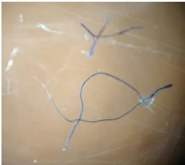
Microfibras de material plástico. Longitud de un lado de la imagen: 1.5 mm.

El promedio, desviación estándar y mediana que se obtuvo para el conjunto de datos, de 11 meses, fueron: 0.028 \pm 0.039 y 0.014 MP/m 3 respectivamente. La Tabla 3 presenta estadísticos de tendencia central obtenidos para el período de muestreo divididos en época seca y lluviosa. Sobresale la alta dispersión de datos de la época seca, causada principalmente por un dato elevado de la zona norte del lago de Coatepeque y otros picos menos elevados en las zonas este y centro (Tabla 2, Figura 3). También, en esta época se recolectaron 351 partículas en cinco meses, cantidad mayor a los 294, que se registraron en el período lluvioso de seis meses. Este dato elevado del mes de enero coincide con el período de mayor intensidad de vientos del norte en el país (Mancuso-Figueroa y Valencia-Azahar, 2017), que pudo causar movimiento de MP desde tierra al agua y suspensión de ese material en sedimentos de la orilla del lago como se observó en el lago Bolsena, Italia (Fischer et al. 2016). Además,