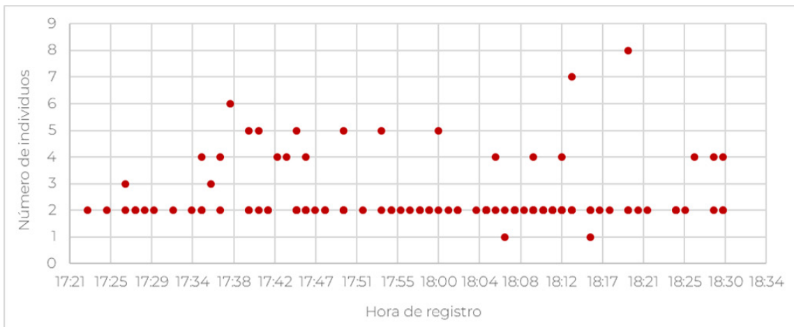
Número de individuos de lora nuca amarilla ( Amazona auropalliata ) registrados de acuerdo con la hora de observación