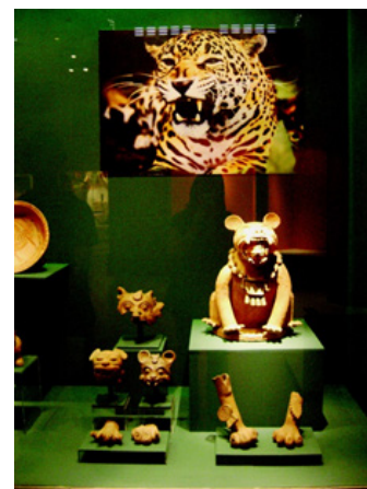
Figura Figuras zoomorfas representando al jaguar. MUNA