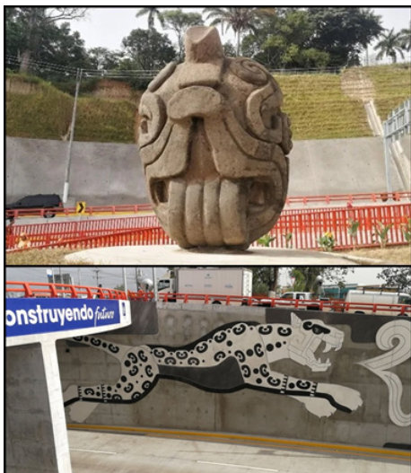
Imagen superior: Réplicas de cabezas de jaguares del sitio arqueológico de Quelepa. inferior: Figura de jaguar. Ministerio de Obras Públicas y Transporte de Salvador

Nota. Tomado de Susana Peñate. La Prensa Gráfica/ 23 de julio del 2018.